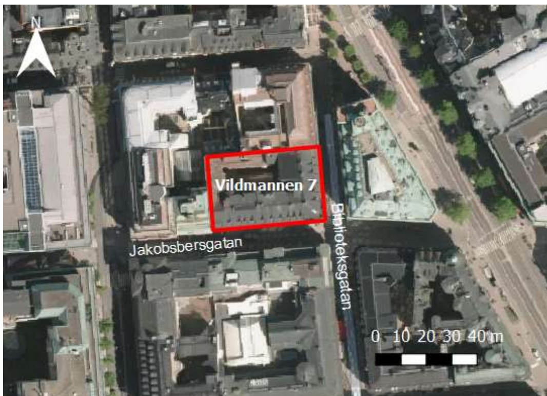
Figur 1. Översiktskarta som visar fastigheten Vildmannen 7 med röd markering.

Syftet med avfallsutredningen är att uppskatta ytbehov för avfallshantering samt antalet avfallstransporter som förväntas för fastigheten kv. Vildmannen 7. Fastigheten ligger i Norrmalm i Stockholm, se Figur 1 för lokalisering.