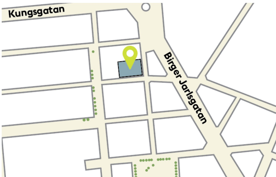
Läget för kv. Vildmannen 7 i Stockholm city, nära Stureplan.

Kv. Vildmannen är beläget i centrala Stockholm intill Stureplan, se karta nedan. Kvartret omges av Biblioteksgatan i öster, Jakobsbergsgatan i söder, Norrlandsgatan i väster och Lästmakargatan i norr.