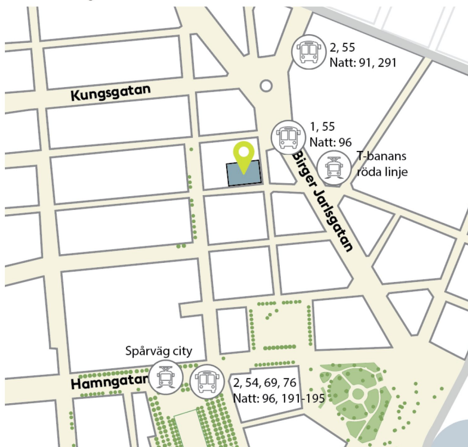
Kollektivtrafikhållplatser i närhet till kv. Vildmannen 7.

Det finns idag inget beslut om att genomföra en ytterligare förlängning av spårväg city mot Norra Djurgårdsstaden och Ropsten. Däremot pågår diskussioner och ett eventuellt besked om genomförande kan komma först sommaren 2019.