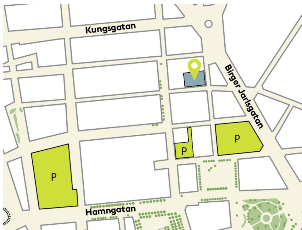
Placering av Hufvudstadens parkeringsgarage i närhet till kv. Vildmannen 7.

Sammanfattningsvis föreslås att kv. Vildmannen 7 löser behovet av 3 bilparkeringsplatser genom förhyrning av platser i närliggande parkeringsanläggningar, till exempel NK-Parkaden, Skären och Rännilen, se kartbild nedan. Dessa anläggningar ligger mellan 100 - 400 m från bostäderna och samtliga ägs av Hufvudstaden AB.