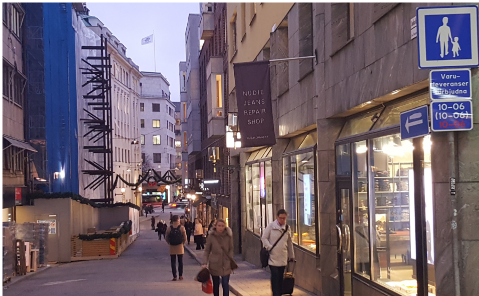
Jakobsbergsgatan är sedan 2017 en gågata.

År 2017 var gångflödet på Jakobsbergsgatan 10 000 per dygn och på Biblioteksgatan 22 000 gående per dygn förbi kv. Vildmannen 7. På Lästmakargatan promenerade 3000 gående per dygn och på Norrlandsgatan 13 000. Samtliga siffror redovisar vardagsmedeldygn, VDT. ( Gångflöde 2017 , Stockholms stad).