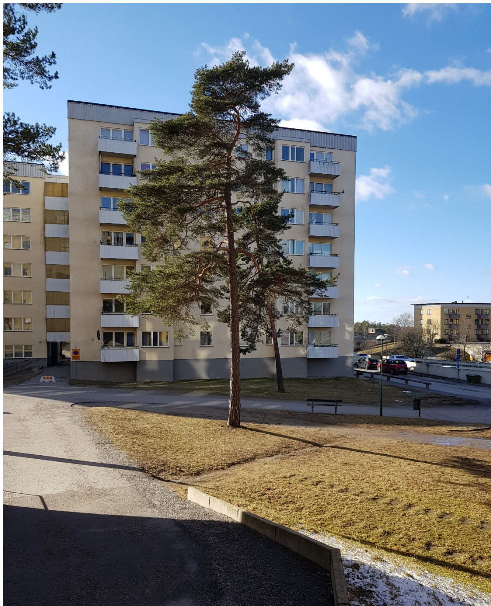
Vy mot bebyggelsen i kvarteret Lillholmen, med ett par av de tallar som finns inom planområdet. Längre bort, till höger i bild, ses ett av husen på fastigheten Stångholmen 2.

skillnaderna i terrängen. Villaområdet i stadsdelen skiljer sig från villaområdena i grannförorterna genom sin placering vid Mälaren, sin storlek och sin tillkomst. Stadsdelen är som helhet mycket lite förändrad. Det har varken rivits, byggts om eller byggts nytt i någon större utsträckning. 3