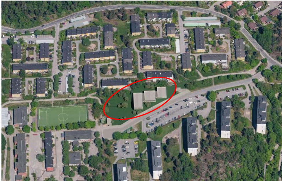
Illustration över den föreslagna förskolan, bestående av grå volymer inringade med rött, enligt planförslaget.