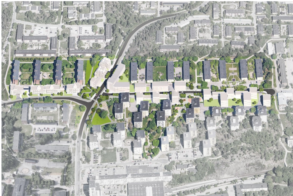
Illustration över den kompletterande bebyggelsen, bestående av vita volymer, enligt planförslaget.

Som underlag för konsekvensbeskrivningen ligger samrådshandlingen med förslag till plankarta och planbeskrivning samt underliggande handlingar, upprättade under första kvartalet 2019.