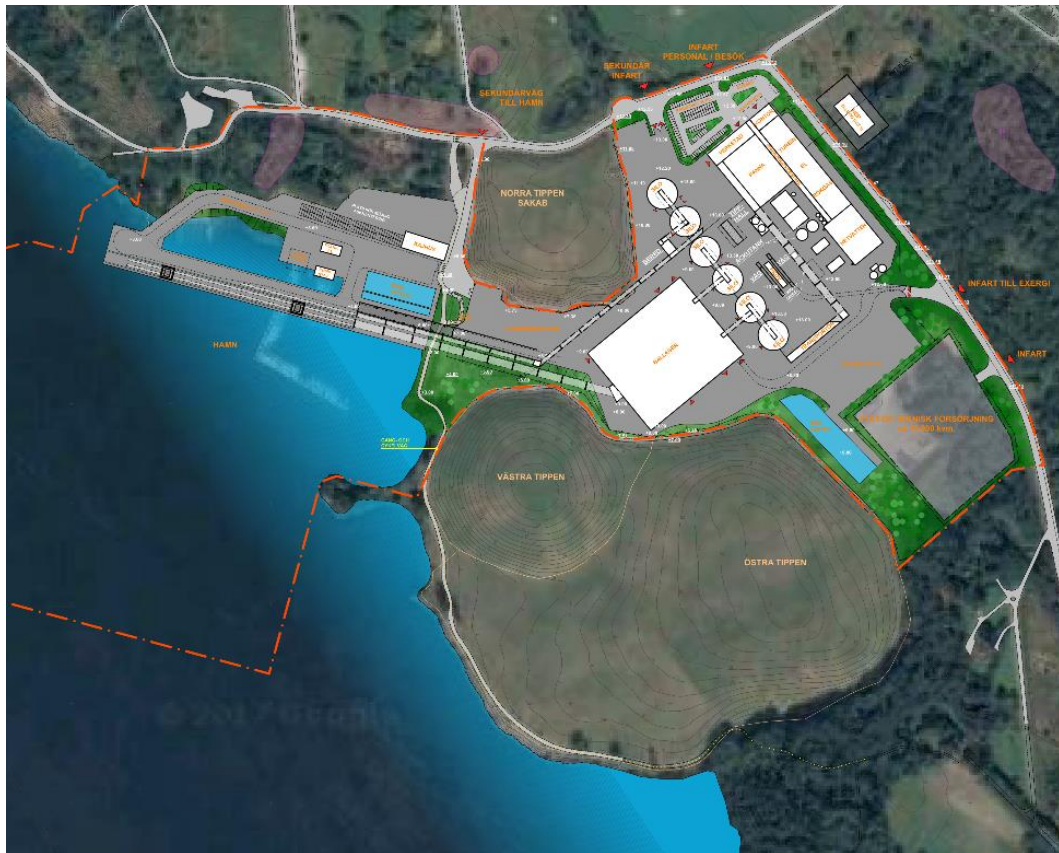
Figur 2. Preliminär situationsplan 2018-11-26. Liljewalls arkitekter.

Anläggningen omfattar en huvudbyggnad samt utrustning för mottagning, beredning och lagring av de olika bränsleslagen. Anläggning för bränslehantering, ballager och cisterner, är placerade mellan kajen och huvudbyggnaden.