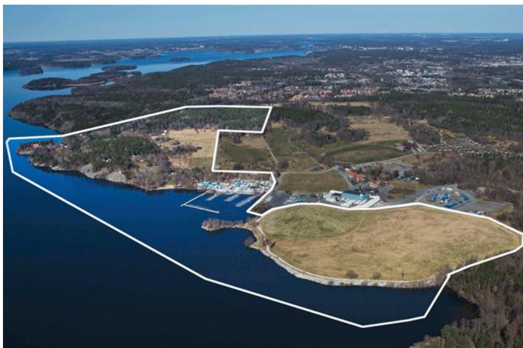
Figur 4. Visar avgränsning enligt samrådsförslag för naturreservat i Kyrkhamnsområdet. Kajen till anläggningen planeras i det utpekade området, mitt i figuren där den befintliga småbåtshamnen ligger (Stockholms stad, 2018).

Hur möjligheterna att inrätta naturreservat påverkas av anläggningen bedöms inte i denna riskbedömning.