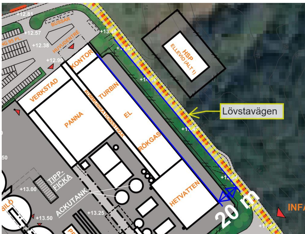
Figur 5. Illustrerar den rekommenderade sekundära transportleden för farligt gods (streckad gul) samt avståndet, drygt 20 m till byggnaderna på anläggningen enligt planförslag.