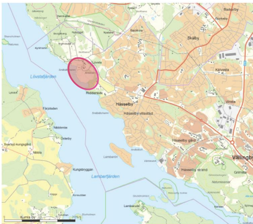
Figur 1. Det aktuella området är markerat i översiktskartan.

En detaljplan för Lövstaområdet planeras att arbetas fram. Syftet med detaljplanen är att pröva möjligheten att uppföra ett nytt kraftvärmeverk på Lövstatippen. Detta omfattar även en kaj med transportband till verket. Anläggningen kommer att utgöra en viktig del i Stockholms framtida effektbalans.