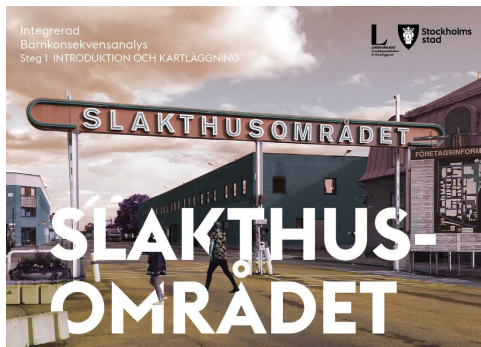
Integrerad barnkonsekvensanalys Slakthusområdet. Steg 1 - Introduktion och kartläggning. (Landskapslaget 2019)

Under 2017 godkände Stockholms stads byggnadsnämnd Program för Slakthusområdet . Programmet utgör ett planförslag för hur en utveckling av Slakthusområdet ska ske och är ett underlag för kommande planarbete. Programmet ska möjliggöra en utveckling av Slakthusområdet i enlighet med Vision Söderstaden 2030 och syftet är att skapa en blandad stadsdel med 3900-4200 nya bostäder, nya arbetsplatser, förskolor, skola, idrottsfunktioner och andra urbana verksamheter som handel, mat och nöjen. Ett annat syfte är att tillvarata områdets speciella karaktär och identitet och att ny bebyggelse planeras så att stadsdelens historia är avläsbar.