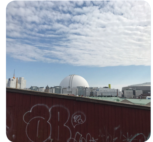
Högsta punkten i Naturparken/Frötallen erbjuder utsikt mot landmärken.