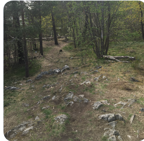
Naturparken/Frötallen har en terräng med möjlighet till utmanande lek.