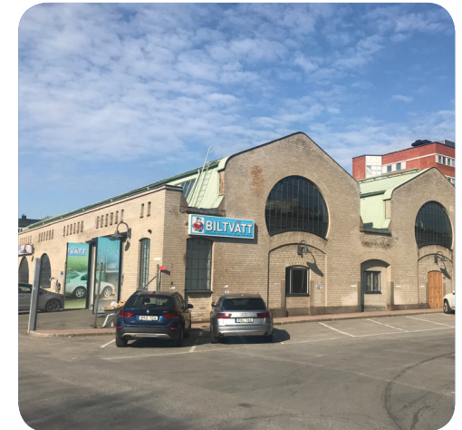
En befintlig byggnad intill Fällanparken som görs om till att inhysa kulturverksamhet.