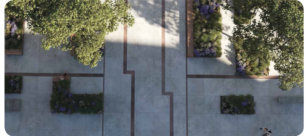
Visualisering som visar mötet mellan olika markbeläggningar i en korsning. Området föreslås att utformas med ett sammanhållande golv (Nyréns Arkitektkontor 2019).

"Målet är en blandad och sammanhängande stadsdel som tar hänsyn till funktionsrätt, jämställdhet och aktiv mobilitet och främjar en socialt hållbar framtid." (Start-PM, Stockholms stad 2018)