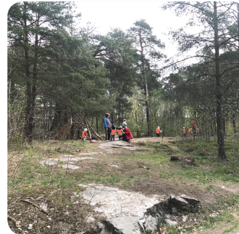
Förskolor använder redan idag Naturparken/Frötallen för utflykter.