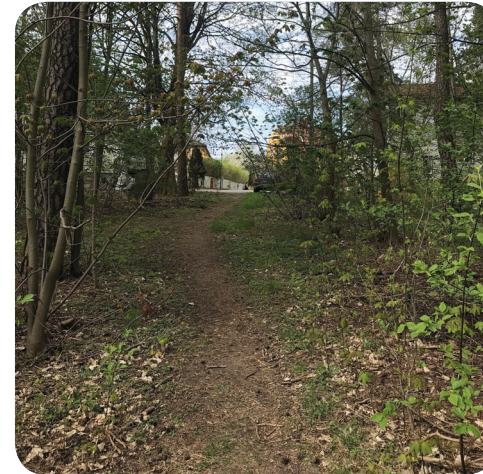
Naturparken/Frötallen kopplar Slakthusområdet till villaområdet vid Lindevägen.