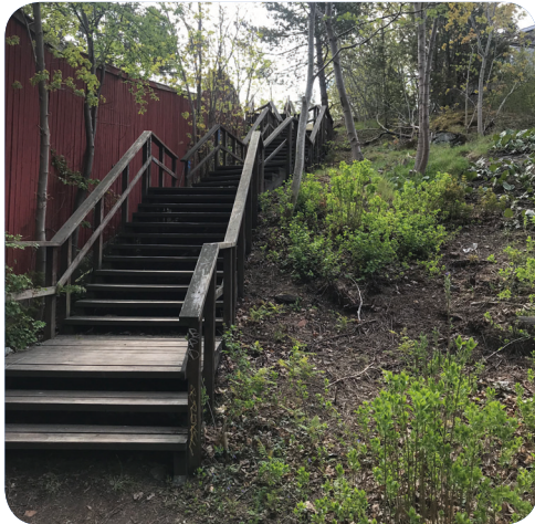
Naturparken/Frötallen har stora nivåskillnader och är smal i vissa passager.