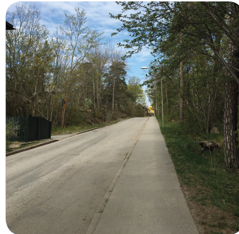
Lindevägen går mellan Naturparken/Frötallen och delar den i två delar.