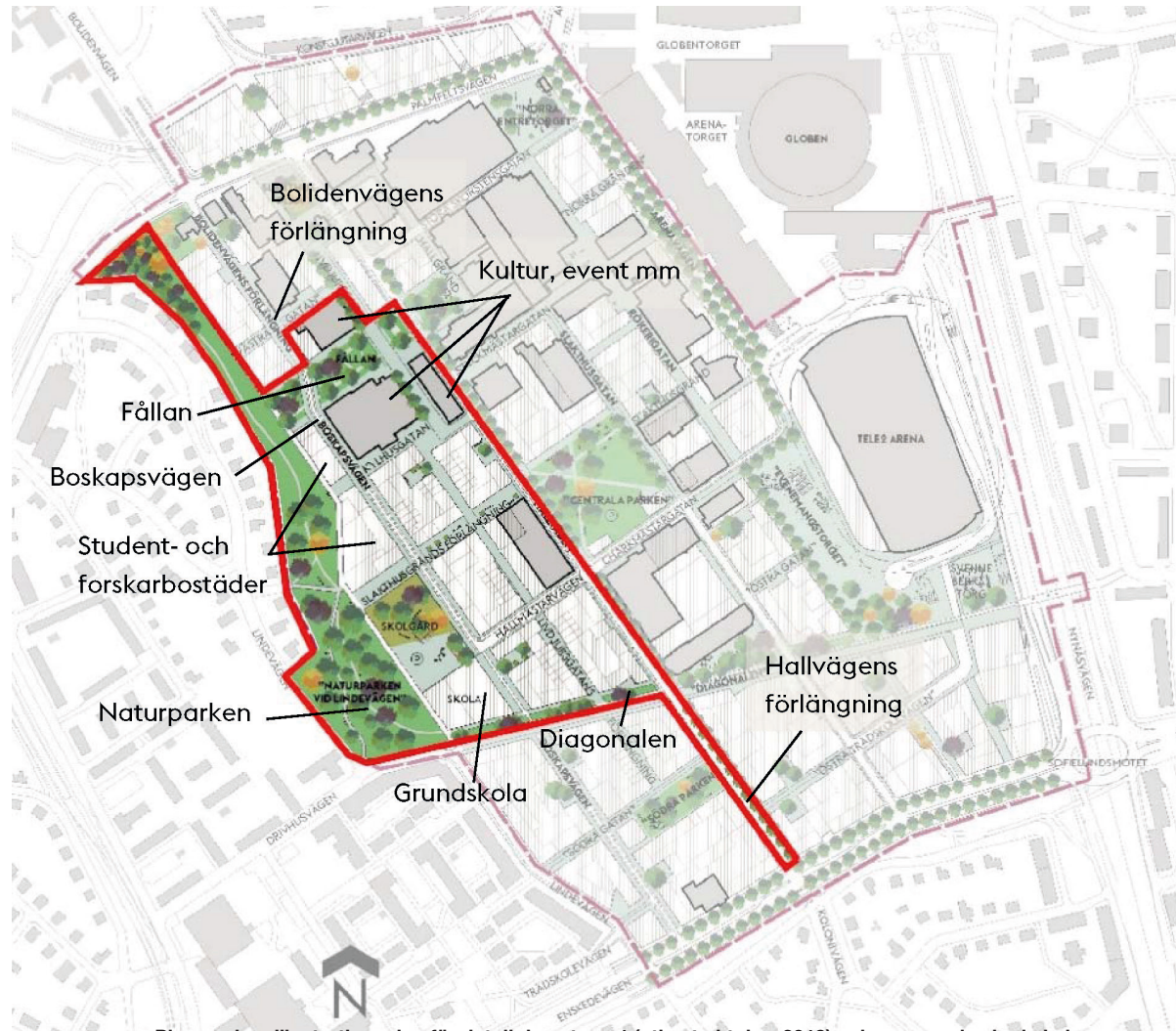
Planen visar illustrationsplan för detaljplan etapp 1 (utkast oktober 2018) och nuvarande skede i planprocessen. Byggnader som sparas är markerade med grå färg.