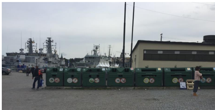
Källsortering på allmänplats norr om planområdet.

Källsortering finns 50 meter norr om tullhus 1..