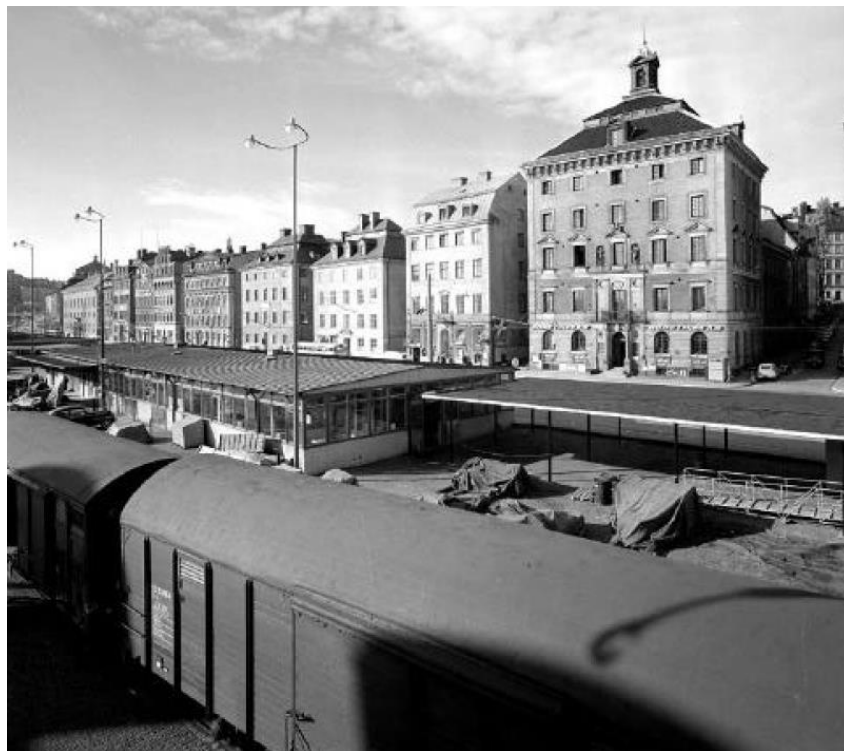
Tullhus 1. Ända in på 1960-talet var det full verksamhet utmed Skeppsbron. Idag är det svårt att förstå den viktiga betydelsen byggnaderna haft för hamnverksamheten.