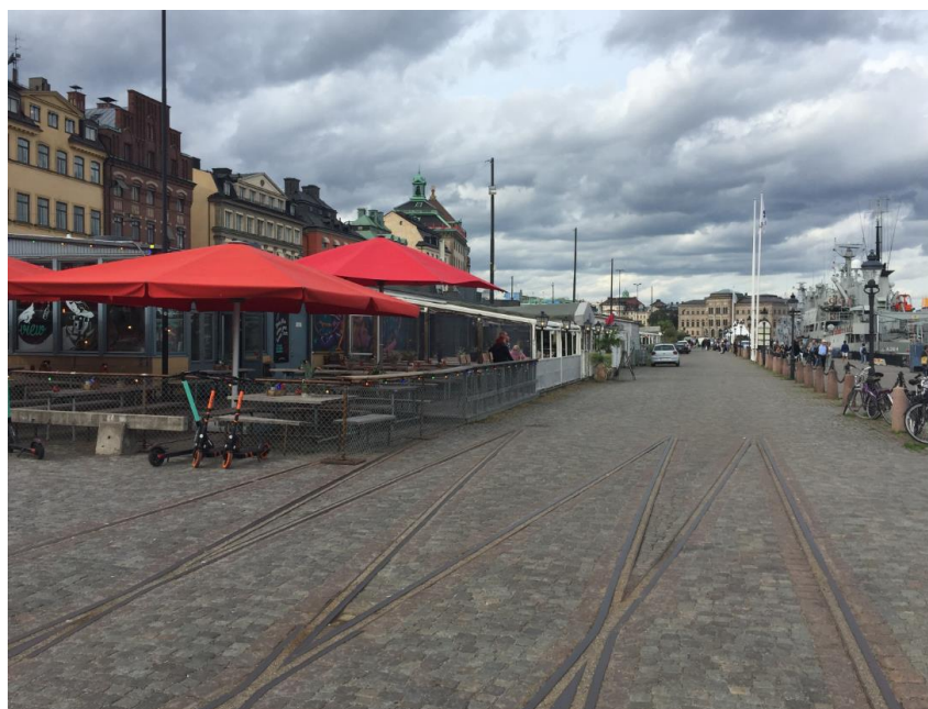
Spår från tidigare järnväg längs kajen.