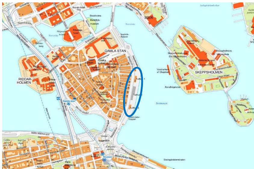
Figur 1, läget för de tre tullhusen markerat med blå ring.