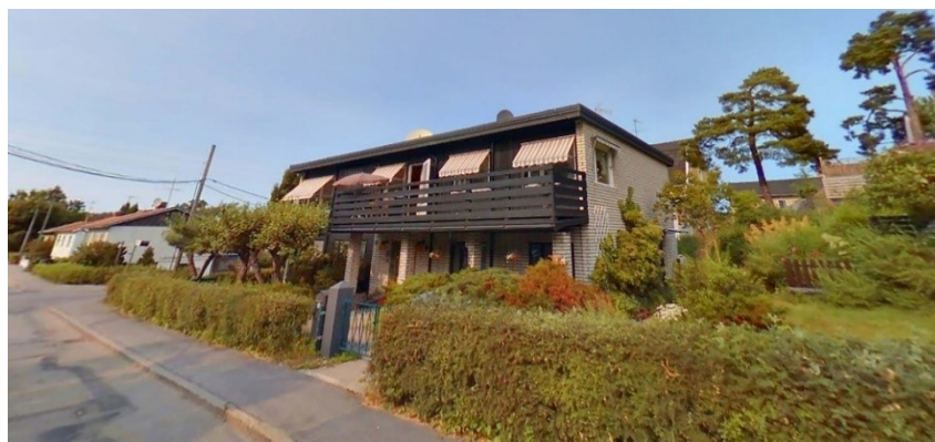
Vy från söder.

Befintligt bostadshus på fastigheten är idag inrett med tre bostäder. Bostäderna har separata entréer och är brandtekniskt avskilda. Det har tidigare konstaterats att bygglov inte kan ges i efterhand då gällande detaljplan endast tillåter två bostäder per fastighet.