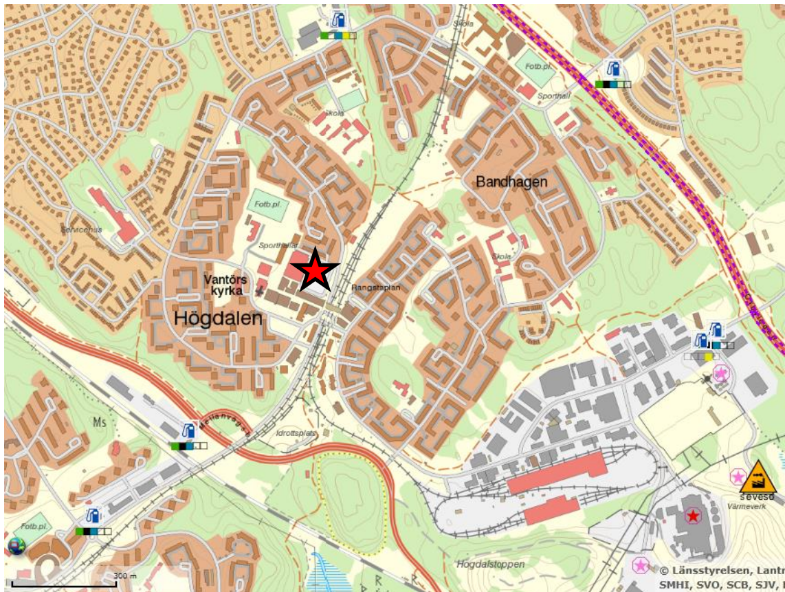
Figur 3. Kartbild 13 över området kring Högdalen, med bensinstationer, rekommenderade transportleder för farligt gods, 2:4-anläggningar och Sevesoanläggningar markerade. Rangstaplan är markerad med en rödsvart stjärna. Skalstreck i nedre vänsterhörn anger 300 meter.

Rekommendationerna i Länsstyrelsens policy 3 anger att rekommenderade transportleder för farligt gods bör beaktas inom 150 meter från planområdet. Detta avstånd bedöms rimligt att tillämpa på samtliga typer av riskkällor i denna utredning. Det innebär att den riskkälla som fortsatt kommer att beaktas i denna analys är riskpåverkan från tunnelbanetrafiken vid station Högdalen. Övriga riskkällor i närområdet, som inkluderar drivmedelsstationer, Sevesoanläggning, rekommenderade transportvägar för farligt gods och järnväg, mm., är alla belägna på minst en halv kilometers avstånd.