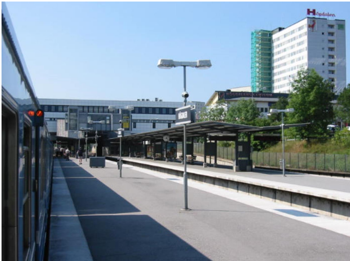
Figur 4. Foto från tunnelbaneperrongen i Högdalen, planområdet syns till höger i bild bakom träden.

Det finns en befintlig höjdskillnad på mer än 2 meter mellan tunnelbanespåret och Sjösavägen (som är belägen mellan planområdet och tunnelbanan). Höjdskillnaden utgörs längs delar av sträckan av en mur, och längs delar av sträckan av en slänt, se Figur 4.