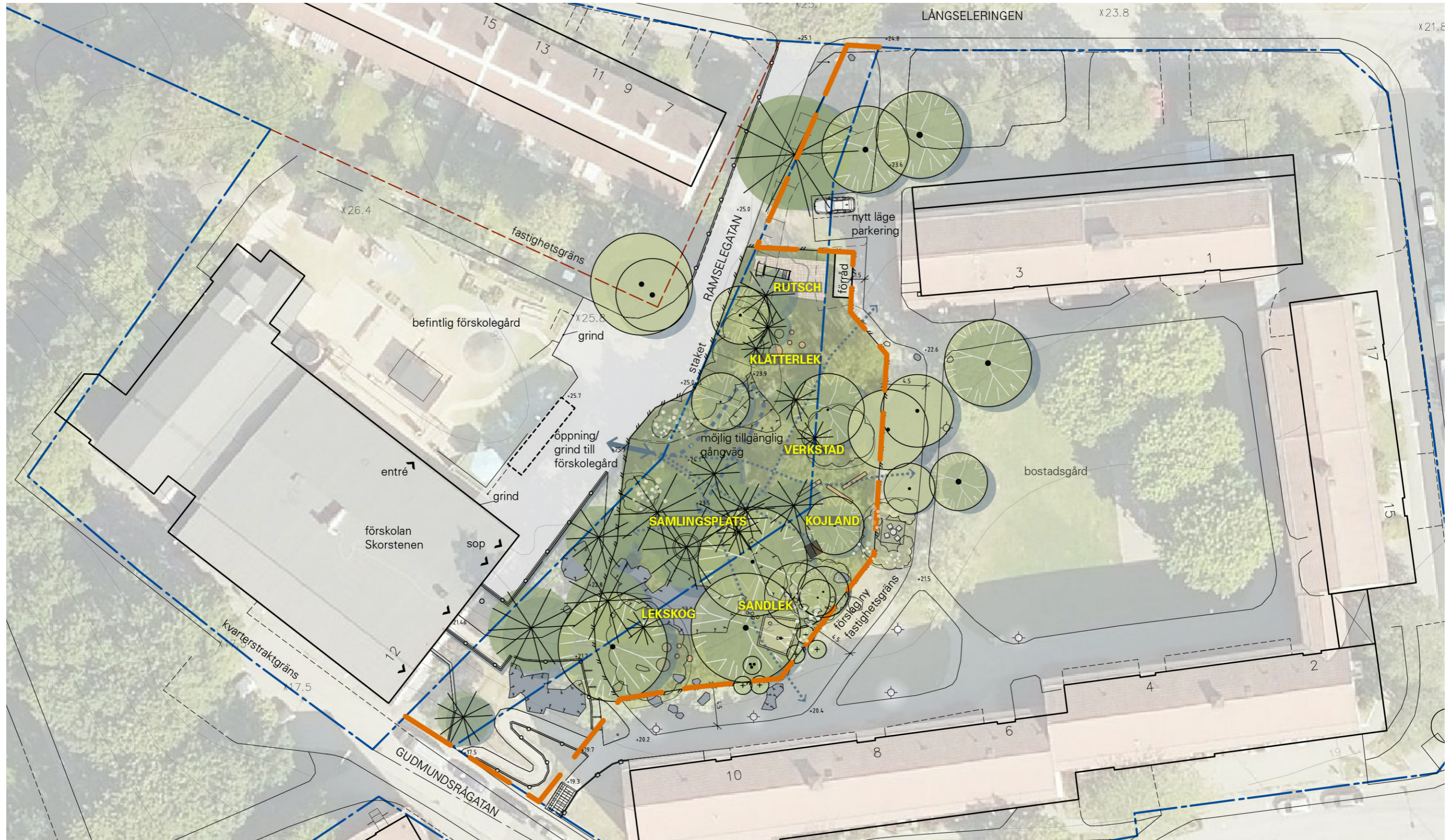
ÖVERSIKTLIG DISPOSITIONSPÅN, SKALA 1:400/A3

Som underlag har använts baskarta, inmätning framtagen av Cowi daterad 2019-06-24 samt trädinventering framtagen av Arbor daterad 2019-07-31.