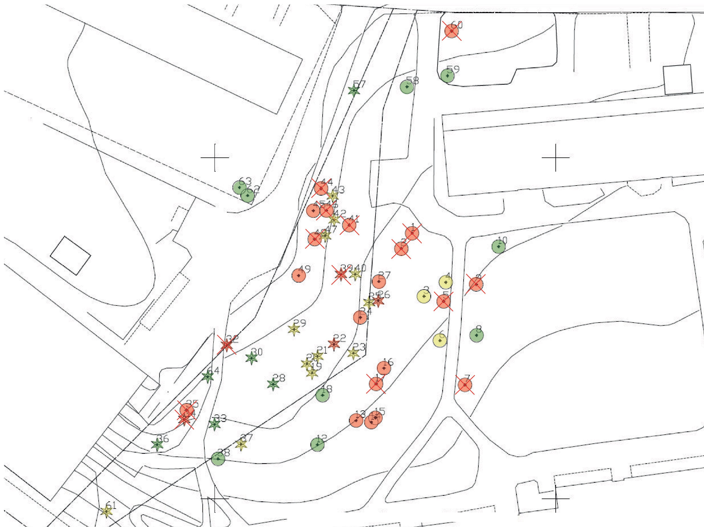
ÖVERSIKTLIG STATUS FÖR BEFINTLIGA TRÄD, SKALA 1:400/A3

Som underlag har använts Trädinventering & okulär besiktning daterad 2019-07-31 och framtagen av Arbor. Träd som fälls har valts ut på grund av dålig vitalitet eller framtida risk.