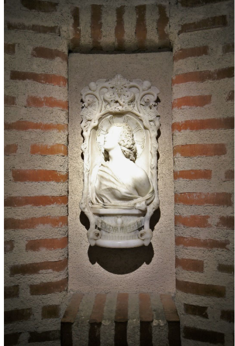
Inmurade byggnadsdetaljer från det rivna Eugeniakapellet, i gårdshuset från 1980-talet.