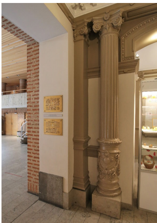
Hanteringen av hur de båda byggnadskropparna från två olika tider hanterats berättar om en tid när ytterligare rivningar i Stockholms stadskärna blivit en omöjlighet.