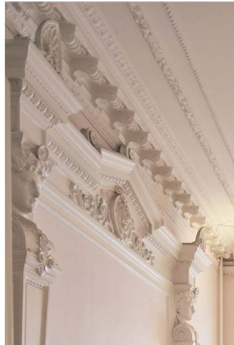
Bevarade byggnadsdetaljer i 1880-paradrummen i gathuset.