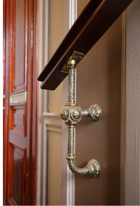
Bevarade byggnadsdetaljer i 1880-talstrapphuset.