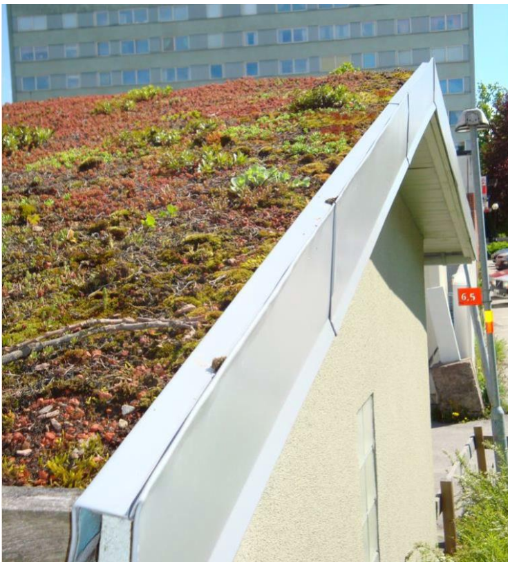
Figur 3. Exempel på extensivt grönt tak.

Alla gröna tak kan behöva lagning av kala fläckar, där skott kan tas från tätvuxna delar. Detta ska göras i maj-september. Krattning rekommenderas och takbrunnar och hängrännor ska hållas fria från skräp. I Figur 3 visas ett exempel på hur ett extensivt grönt tak kan se ut. Gröna tak som dagvattenanläggning fyller för det mesta funktion av fördröjningsanläggning för att minska avrinning från takytor.