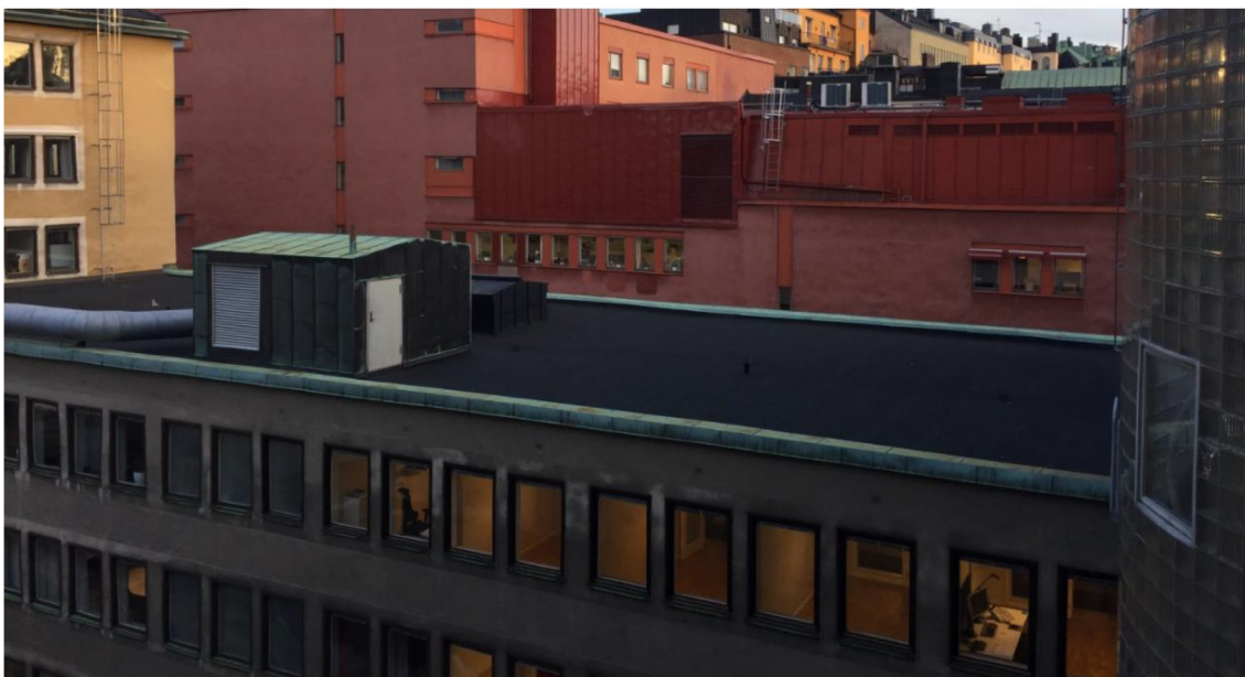
Figur 1. Nuläge: Tak med kopparkrön och kopparklätt fläktrum.