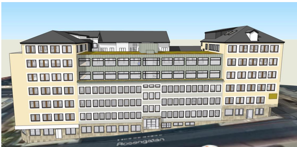
Figur 2. Figuren visar den planerade utformningen av påbyggnaden. Urklipp från illustration av utformning vy alt. 4 från Thule Fastighetsutveckling AB.