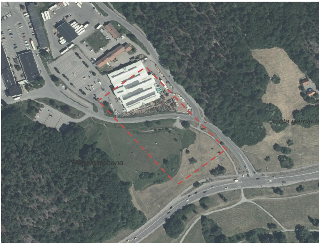
Figur 2. Ortofoto, ArcGIS, 2019-10-29.

Strax nordöst ligger ett höjdparti med nivå ca +34, bestående av skog och berg.