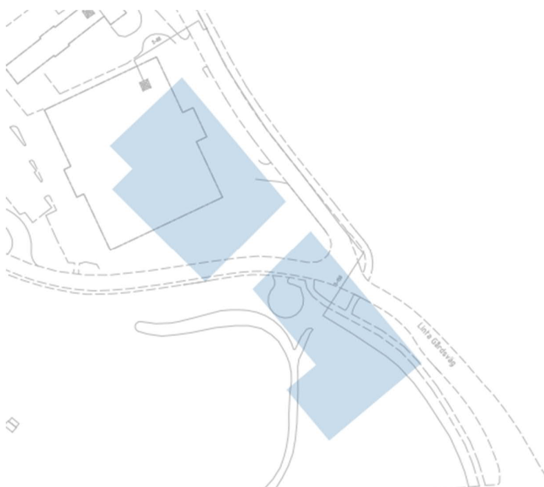
Figur 1. Områdesöversikt, Kvarter 2 och 3, 2019-10-29.

En skiss av områdets eventuella utformning visas i Figur 1 nedan.