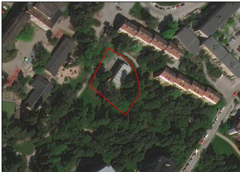
Figur 1. Undersökningsområdet visas med röd ellips.