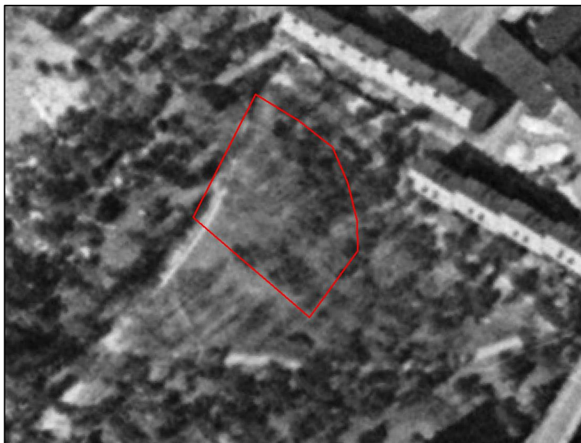
Figur 2. Flygfoto från 1960. Undersökningsområdet visas med röd ellips. Källa: Esri, HERE, Garmin, ©, OpenStreetMap contributors, and the GIS user community; Source: Esri, DigitalGlobe, GeoEye, Earthstar Geographics, CNES/Airbus DS, USDA, USGS, AeroGRID, IGN, and the GIS User Community.

Enligt historiska flygfoton från 1975 (se Figur 3) ses byggnaden från 1962 i den norra delen av fastigheten, strax söder om gång- och cykelbanan. Flygfoto från 1960 (se Figur 2) visar att området utgjordes av skog innan uppförelse av byggnaden år 1962.