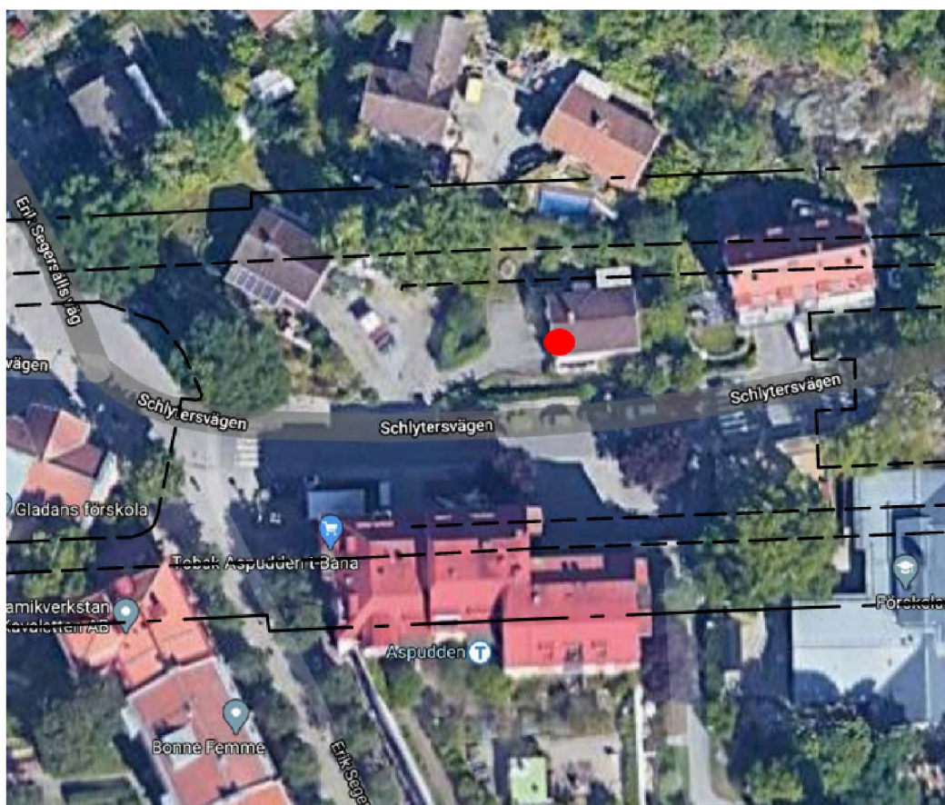
Bild 1 Använd mätposition för vibrationsmätning visas med röd cirkel i bild. Svarta streck visar tunnelbanans sträckning

Vibrationsmätning utfördes på befintlig garageplatta i källarplan i befintlig villa på Schlytersvägen 54, se nedanstående bild som visar mätpositionen samt tunnelrörens placering.