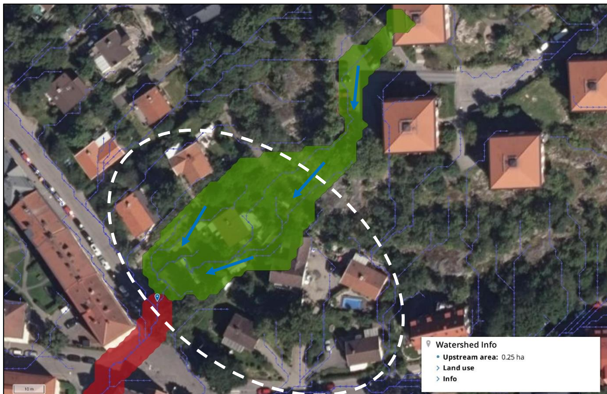
Figur 1. Ekens avrinningsområde, markerat med en grön polygon, enligt Scalgos modellerade avrinningsvägar. Ekens ungefärliga placering är markerad med en kartnål och Kv. Sothönan visas ungefärligt med en vitstreckad ellips. Bakgrundskarta från Lantmäteriet.