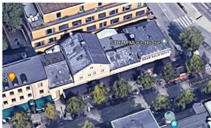
Vy från söder

Försörjning med kyla kan anordnas med egen kylmaskin eller försörjning från kylmaskincentralen i Konsthallen 2.