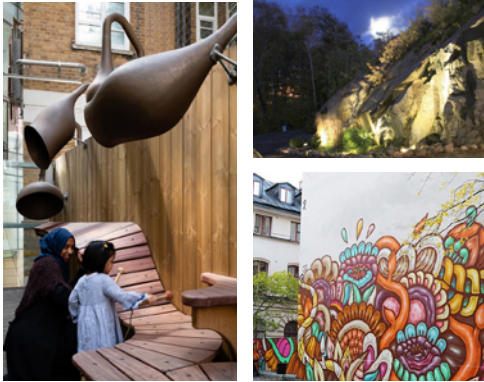
Förslag på hur gångstråket mot bergväggen kan aktivieras (ovan). Referensbilder är framtagna av Cedervall Arkitekter (2020).