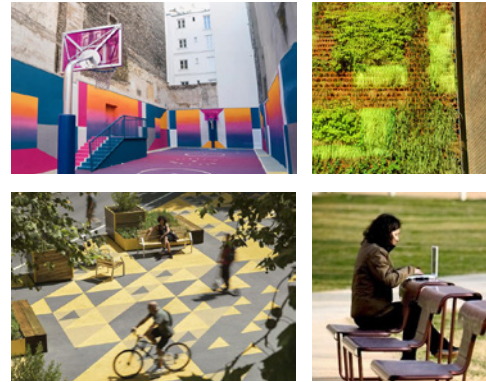
Visionsbilder på hur Västra gatan kan aktivieras. Referensbilder är framtagna av Cedervall Arkitekter (2020).