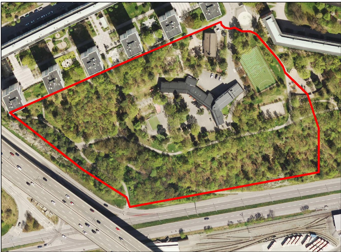
Figur 3 - Område som inkluderats i utvärdering.

Beräkningsresultat återges i bilaga 1 till denna utredning. I bullerkartan motsvarar gröna ytor en ekvivalent trafikbullernivå under 50 dBA ( L_{Aeq,24h} ) och dessa ytor ligger därmed inom Naturvårdsverkets riktvärde för lek, vila och pedagogisk verksamhet avseende ny skolgård.