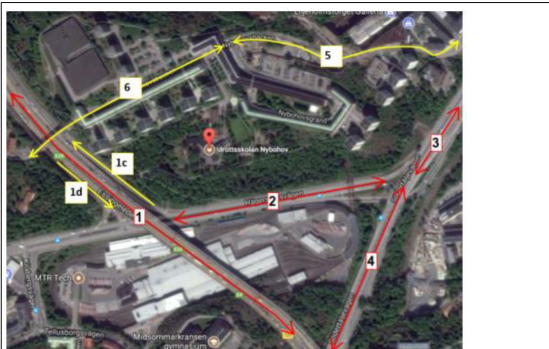
Figur 1: Karta, länkar

Trafikflödesdata som ligger till grund för beräkningar bygger på Structors översiktliga trafikprognos (v.2 2017-10-2d6) . Beräkningar har utgått från prognosåret 2030. Skillnaden mellan nulägesituation och framtidsprognos för 2030 är dock obetydlig då trafikflöden på Essingeleden , som är den dominerande bullerkällan, ej väntas förändras. Utdrag från trafikprognosen med aktuella vägavsnitt och trafikflöden återges nedan.