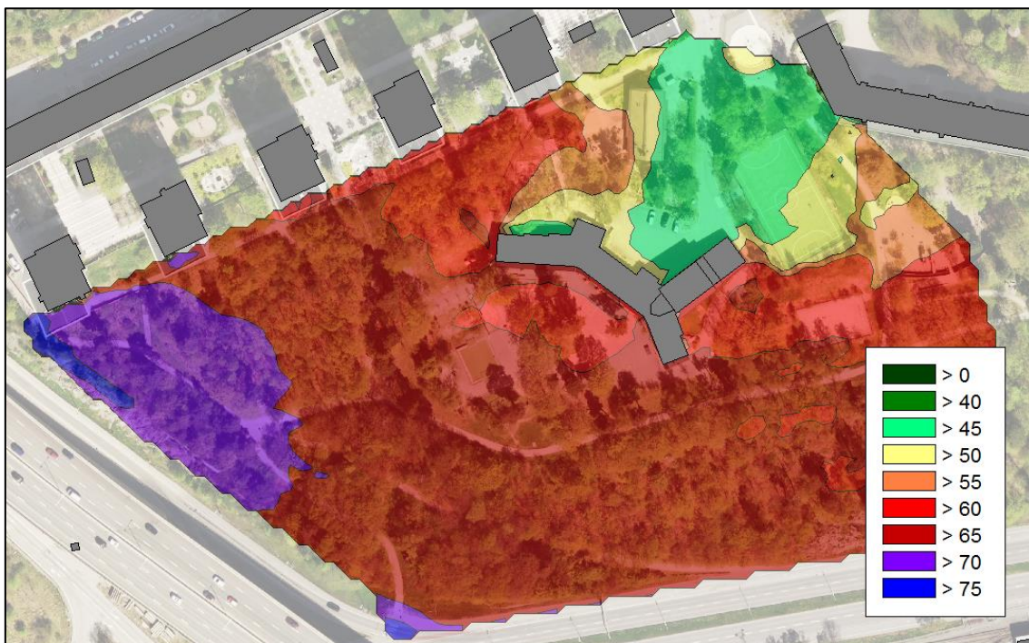
Figur 1 - Ekvivalenta trafikbullernivåer utan nya byggnader, prognosår 2030 (dB, L_{Aeq,24h} ).

Vid området sydvästlig riktning från den befintliga Idrottsskolan, där de nya byggnaderna planeras, beräknas ekvivalenta bullernivåer från trafik hamna kring 65-70 dBA med oförändrad situation, se figur nedan.