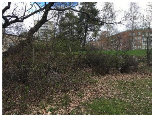
Figur 6. Naturvärdesobjekt A utgörs av en parkliknande miljö med varierad trädskikt.