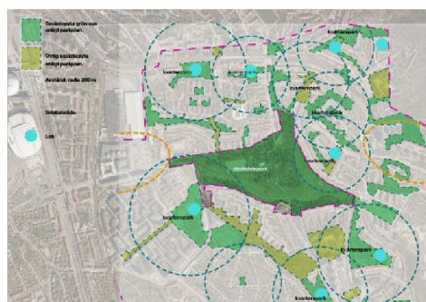
Nulägesbild som visar på befintliga sociotopytor och gröna oaser.