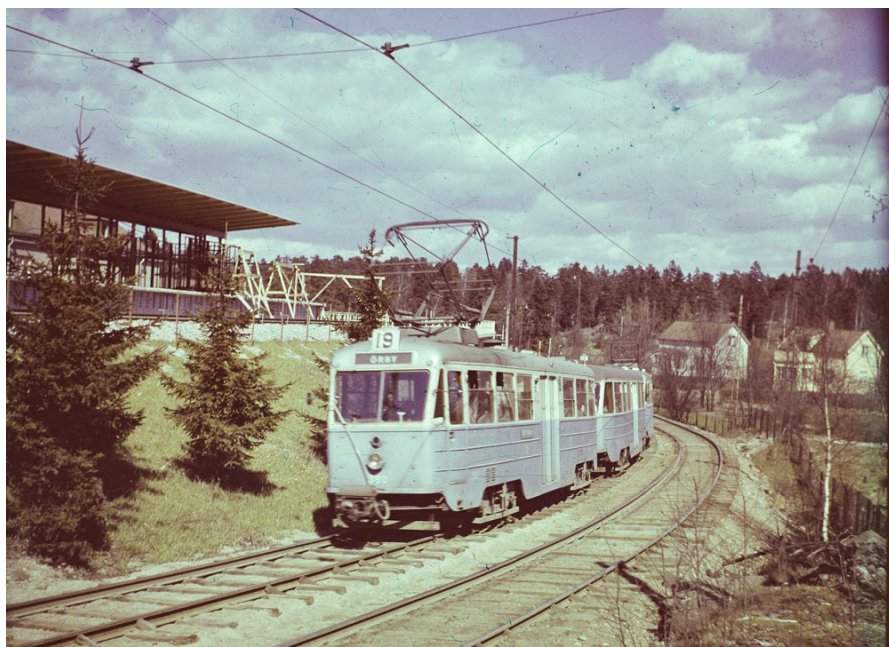
Linje 19 mot Örby fotograferad 1951, före dess att den ersattes av tunnelbanan vars station var under uppförande när bilden togs.