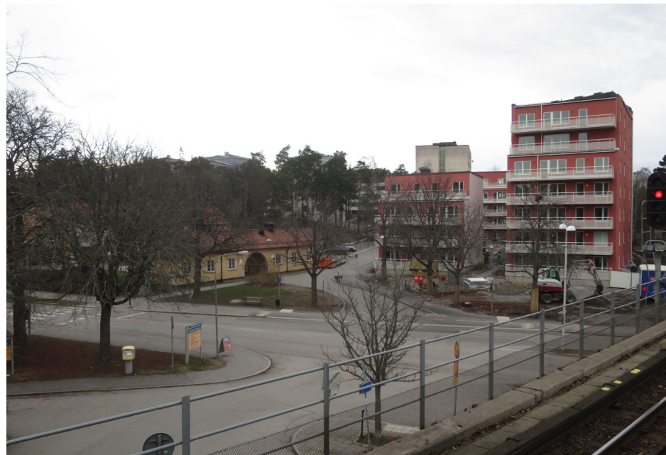
Mellan portalbyggnaden till f.d. Gammelbyns sjukhem och tunnelbanespåret pågår bygget av nya flerbostadshus i HSB:s regi.

Sedan några år in på 2000-talet har en relativt omfattande förtätning ägt rum vid Svedmyraplan. Förtätningen har gjorts med nya flerbostadshus med i huvudsak "vanliga" lägenheter. Lägenheterna i kv. Domaren (uppfört 2013) är dock avsedda för personer som är 55 eller äldre. Sammantaget har de nya byggnaderna brutit upp karaktären av institutionsbälte, "vanliga" bostäder har kilats in mellan kategoriboen- dena och de sociala inrättningarna.