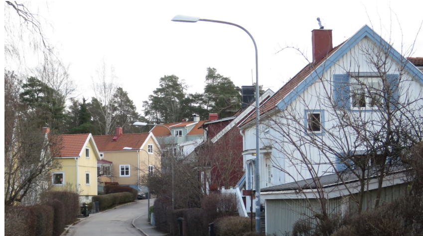
Häckar och fruktträd verkar sammanhållande i småstugemiljön.

Småstugornas ursprungliga likformighet med några få hustyper är idag inte lika tydlig efter de många tillbyggnader som gjorts. Det är dock uppenbart att byggnaderna uppförts med en gemensam grundtanke. Om detta vittnar inte minst de välskötta häckar som kantar gatorna. De typritade småhusen har en prydlig och något sluten utformning med entréer många gånger vända mot gården. Detta tillsammans med stående locklistpanel i pastellfärgade kulörer, sadeltak täckt av takpannor och ett stramt, välordnat gaturum utgör området värdebärande karaktärsdrag.