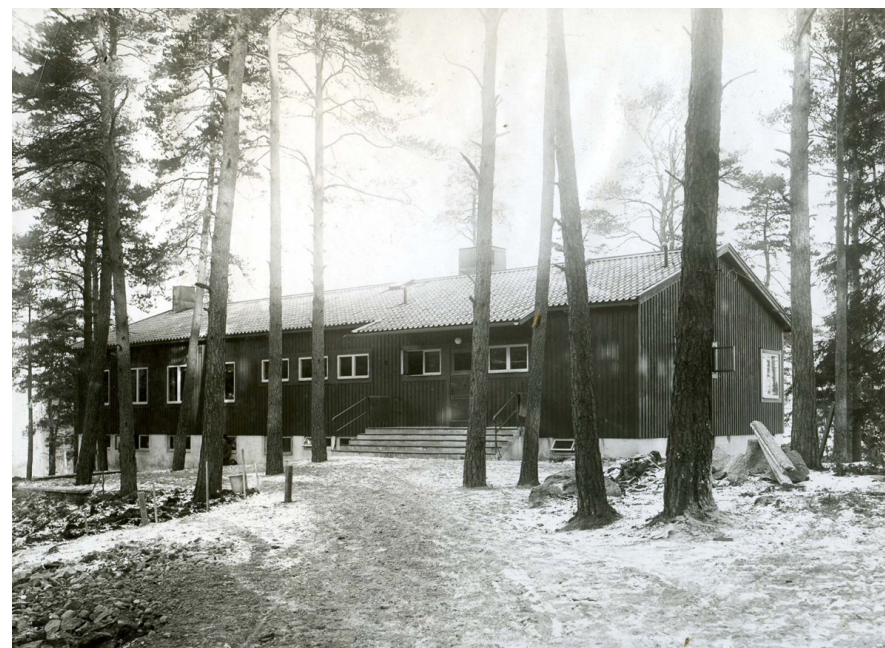
Enskede sportstuga fotograferad 1932.

I anslutning till det nya området fanns Sveriges modernaste ålderdomshem. Gammelbyns ålderdomshem norr om Tussmötevägen invigdes 1930 efter att ha byggts ut under 1920-talet. Anläggningen uppfördes av Stockholms stads fattigvårdsnämnd och omtalades vid invigningen som Sveriges och kanske Europas modernaste ålderdomshem. Det mer storskaliga Stureby sjukhem på södra sidan av Tussmötevägen invigdes 1935 och rymde inte mindre än 710 vårdplatser.