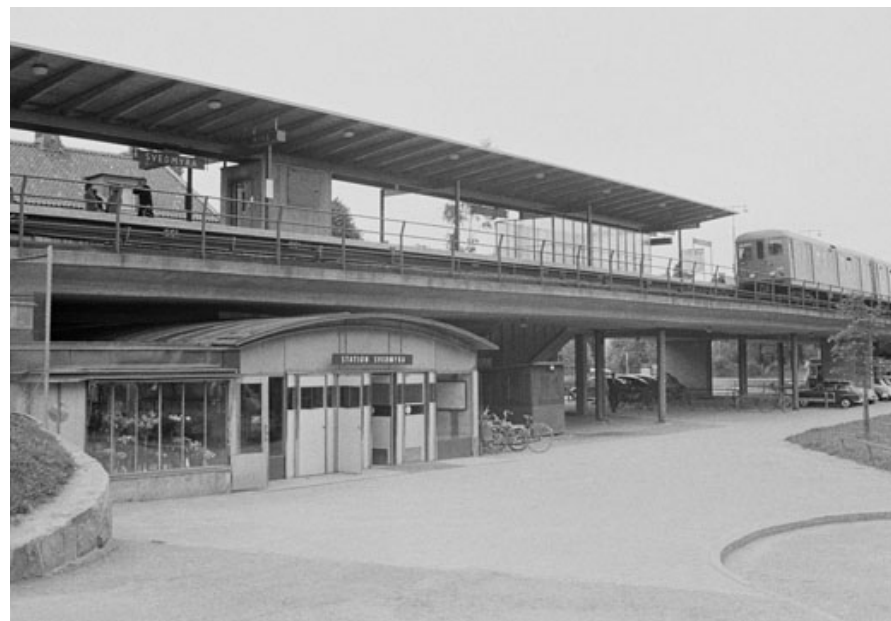
Tunnelbanestationen år 1963.

Under 1950-talet byggdes också småstugeområdet ut österut, nu med byggnader i murat och putsat utförande.