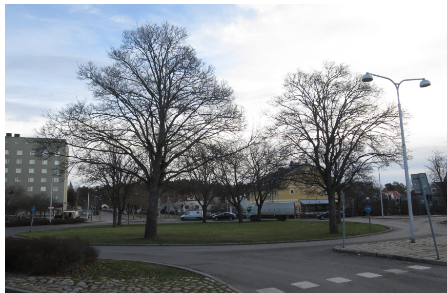
På ena sidan av gatan åttaväningsbebyggelse, på andra sidan småstugor. Hotellbyggnaden och träden i rondellen mjukar upp det abrupta mötet mellan olika skalor.

Vid sidan av grönskan är det slående hur stor kontrasten är mellan olika bebyggelseskalar. Skivhuskomplexet i kv. Sexmännen möter småstugorna direkt. I tunnelbanestäderna finns inte det direkta mötet mellan småhus och utpräglad centrumbebyggelse. Där ligger flerfamiljshusen emellan. Mötet mellan så skilda skalor är ett särdrag för Svedmyraplan och berättar om samhällsutvecklingen under mellan- och efterkrigstiden.