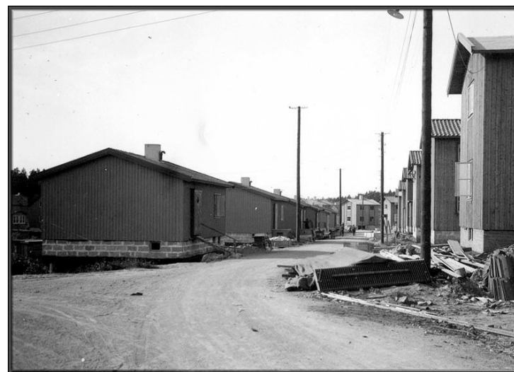
Småstugeområdet under utbyggnad, 1930-talets första år.

Småstugeområdet i Svedmyra, söder om Svedmyraplan, byggdes ut enligt dessa idéer med start 1932 efter att en stadsplan utarbetats föregående år.