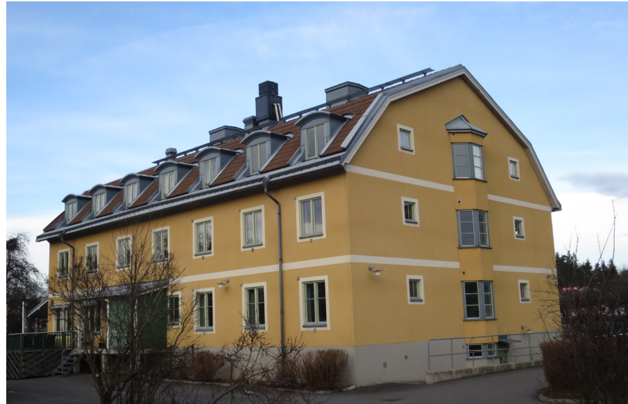
Hotellbyggnaden är tydligt influerad av 1920-talets Enskede.

Hotellet är uppfört i en postmodernistisk anda med tydlig influens från annan tongivande bebyggelse i Enskede. Eventuellt kan 1920- och 30-talsbebyggelsen i Gamlebo och Stureby sjukhem ha fungerat som inspiration. Byggnaden har släta putsfasader, rytmiska placerade raka fönsteraxlar, burspråk och brutet tak med takpannor.