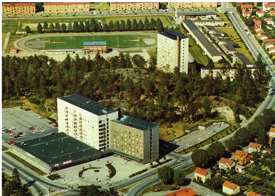
Flygfoto från 1970-talet som visar den nyuppförda anläggningen med torg och parkeringsytor. I bakgrunden syns Enskede idrottsplats och de olika kategoriboendena i kv. Palsternackan.

Anläggningen byggdes ut med lågdelar för pensionärs- och invalidboende i början på 1960-talet. Samtidigt skedde en utbyggnad av Gammelbyns ålderdomshem, både med nya vårdplatser och med personalbostäder. Skalan och den arkitektoniska utformningen var väsensskild från den ursprungliga bebyggelsens. Tankarna från tidigt 1900-tal om att låta institutionerna stå i direkt kontakt med skogen bibehölls dock.