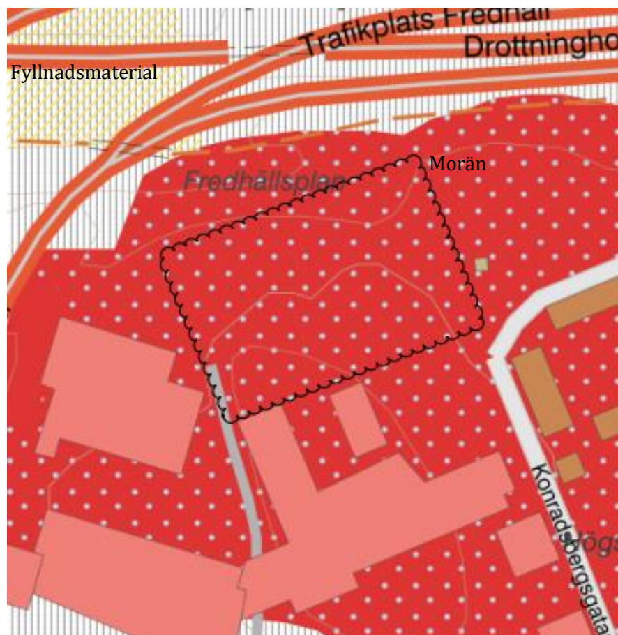
Figur 2. Jordartskarta för området (SGU, 2021). Ungefärligt undersökningsområde ses inom svart markering.

Enligt Sveriges Geologiska Undersöknings kartvisare (SGU, 2021) består jordlagret inom undersökningsområdet av tunt eller osammanhängande lager av morän, med fyllnadsmaterial norr om området, se Figur 2 . Jorddjupet uppskattas vara 0 meter inom området. Genomsläppligheten inom undersökningsområdet medelhög (morän och berg). Enligt SGU's brunnsarkiv finns det inga dricksvattenbrunnar inom närområdet, närmsta energibrunn återfinns ca 60 m sydväst om objektet.