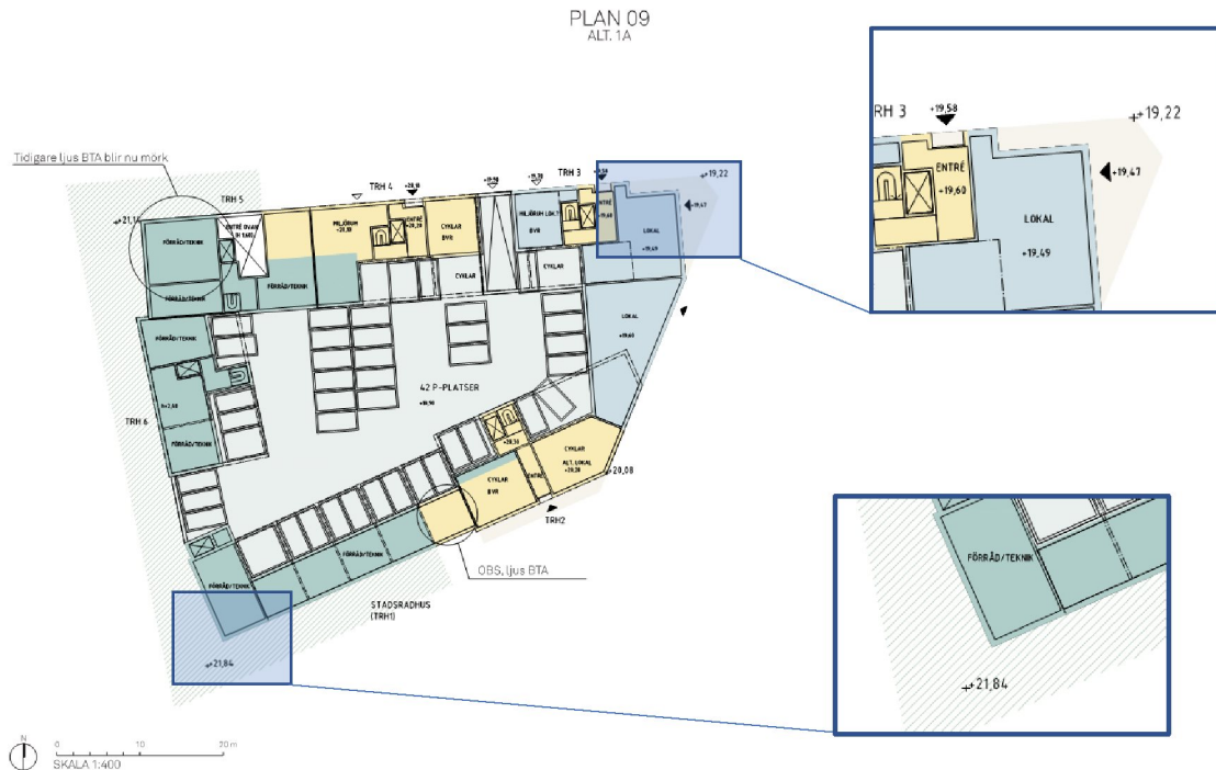
Figur 2, Högsta och lägsta markhöjder runt kvarteret, Semrén+Månsson/OBOS

Gator byggs enligt uppgift från Exploateringskontoret Stockholms Stad före bostadskvarteret vilket medför att möjligheter till släntschakt begränsas. För delar av kvarteret fordras därför stödkonstruktioner (spont) mot gata vid schaktning.