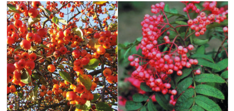
Bärande träd som rönn och prydnadsapel