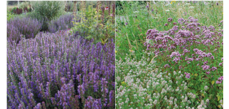
Aromatiska fjärilsväxter som isop och kungsmymta

För att stödja karaktärshabitatet föreslås mindre vattenspeglar där regnvatten kan samlas innan det breddar vidare till planteringsytor. Dessa vattenspeglar ger både upplevelsevärden och fungerar som platser för fåglar och insekter.