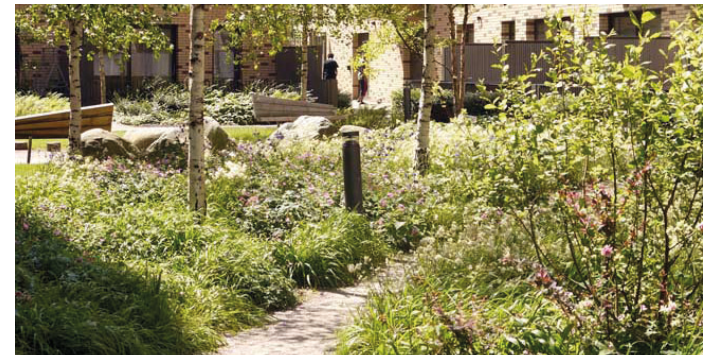
Mindre gröna rum och mindre stigar