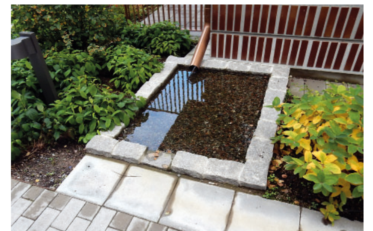
Vattenspeglar efter regn