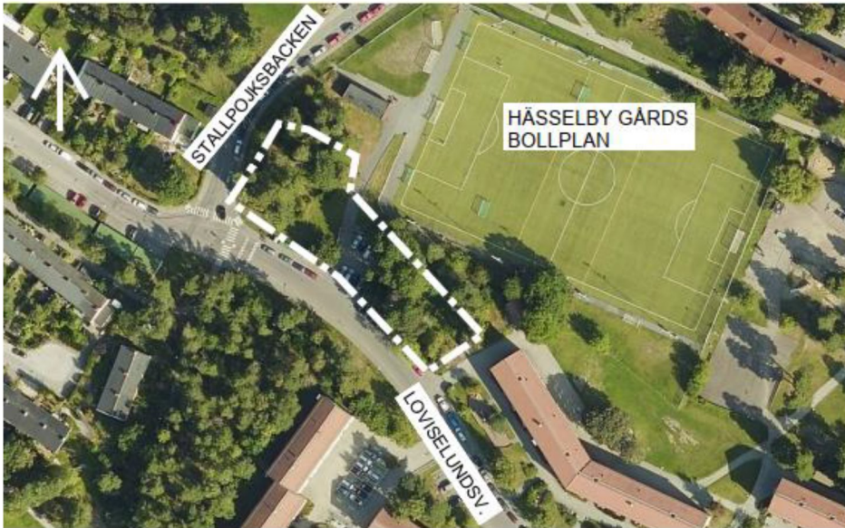
Figur 1. Aktuellt undersökningsområde översiktligt markerat i vitt (streckat).

Tyréns AB har i samband med en geoteknisk undersökning i detaljplaneskede inom och intill fastigheten Springbrunnen 1 i Hässelby, Stockholm, genomfört en radonundersökning, se figur 1.