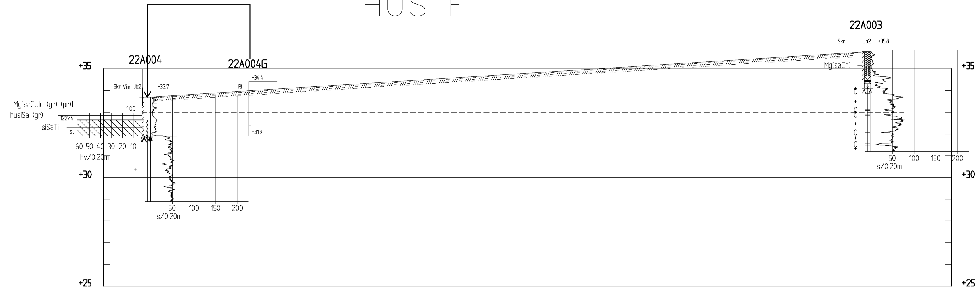
SEKTION A-A 1:100