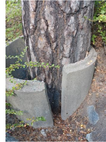
Bild 1. Betongrundel runt träd 1.

Träd 2 har stått lutande under flera år, men det har liten korrigerande tillväxt (upprättväxande topp). Sprickor i betongen runt stam (bild 2) kan indikera på att trädet ändrat lutning sedan rundeln placerades där. Sprickan i betongen kan även bero på sättningar/rörelser i marken. Betongrundeln runt träd 1 (utan nämnvärd lutning på stam) är ej heller centrerad utan ligger an mot stam. Min bedömning är att risken för att träd 2 ska falla och orsaka skada på person eller egendom är måttlig (i en skala låg-måttlig-hög-mycket hög).