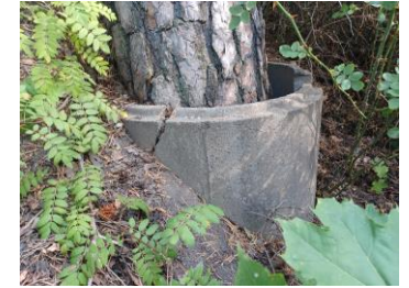
Bild 2. Betongrundel runt träd 2. Spricka i betong kan indikera på att trädet ändrat lutning sedan rundeln installerades.