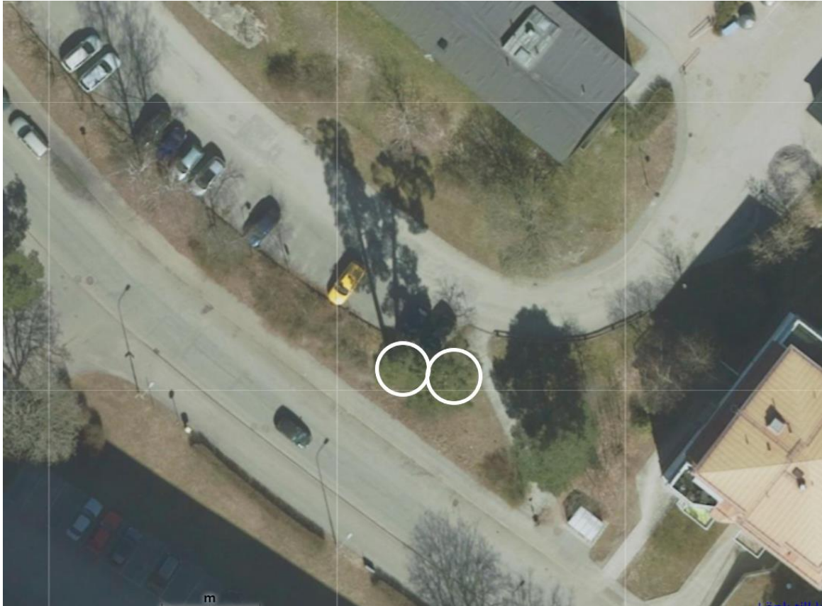
Trädlista, besiktigade träd inringat i vitt.