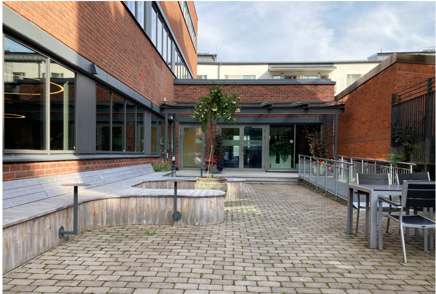
Takytan i öster som idag används som gård.