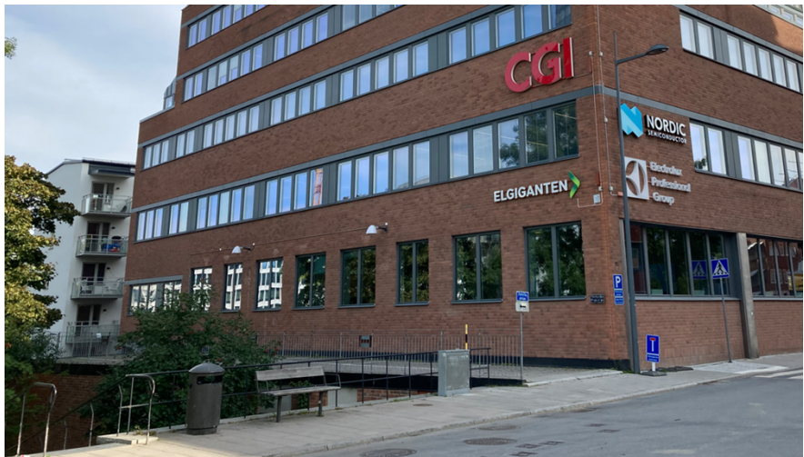
Takytan i väster mot Franzéngatan som idag används som gästparkering.