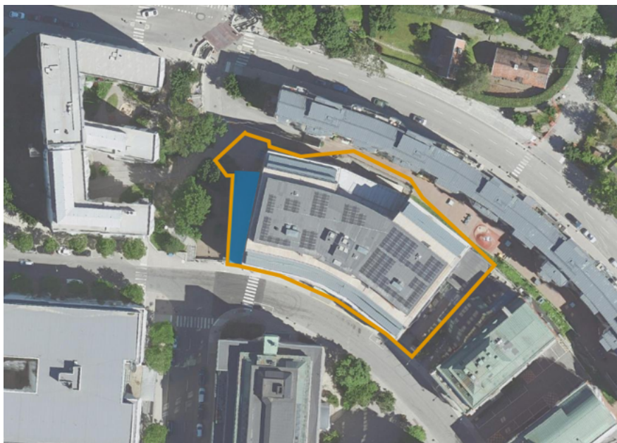
Ortofoto av fastigheten (gulmarkering) och gästparkering i västra delen (blåmarkering).

Fastigheten utgörs helt av hårdgjorda ytor. Förslaget ämnar förbättra dagvattenhanteringen inom fastigheten och skapa en mer attraktiv utomhusmiljö. Takytan på den västra byggnadsdelen som idag används som gästparkering föreslås förses med planteringsytor samt växtbäddar, sittplatser och fler cykelparkeringsplatser.