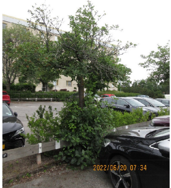
Ett träd i oxelraden mitt på parkeringen – nedsatt vitalitet med döda kron delar.