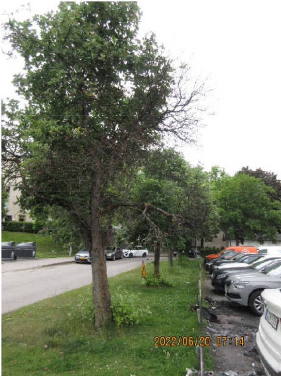
Träd nr 5 med brännskada.