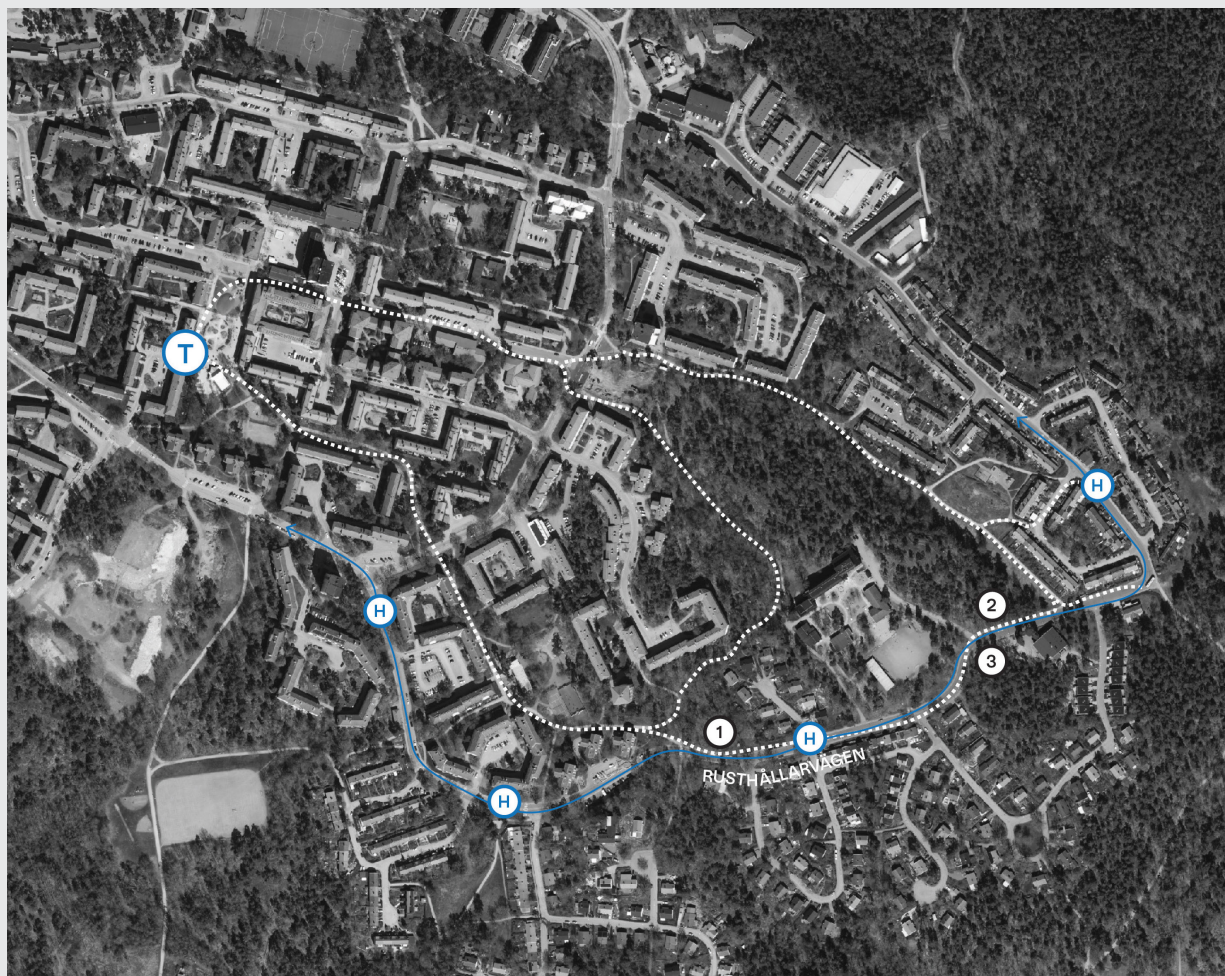
Tomternas placering längs Rusthållarvägen och streckan av busslinje 161 i Bagarmossen.

Det är ungefär lika nära till Bagarmossens centrum med ett omfattande serviceutbud. I samband med projektet planerar Stockholms stad även att rusta upp och bredda närliggande gång- och cykelbana som ett led i att främja hållbara resmönster.