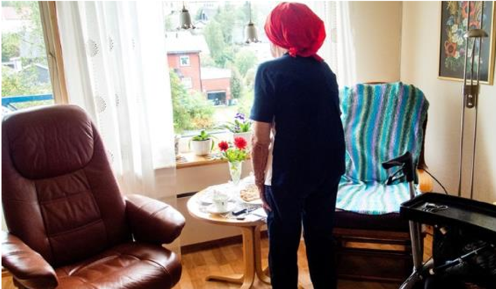
"Ensamhet är lika skadligt som rökning"