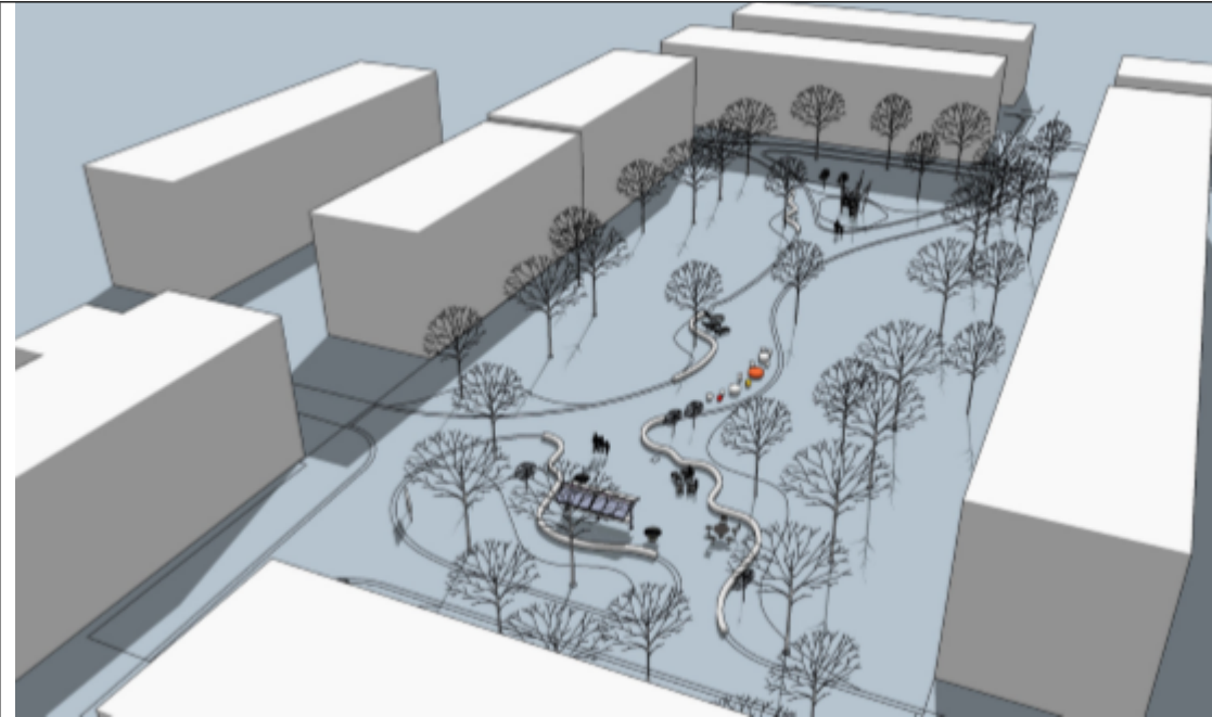
Ovan syns vy över gestaltningsförslaget vid Sunnanbyplan