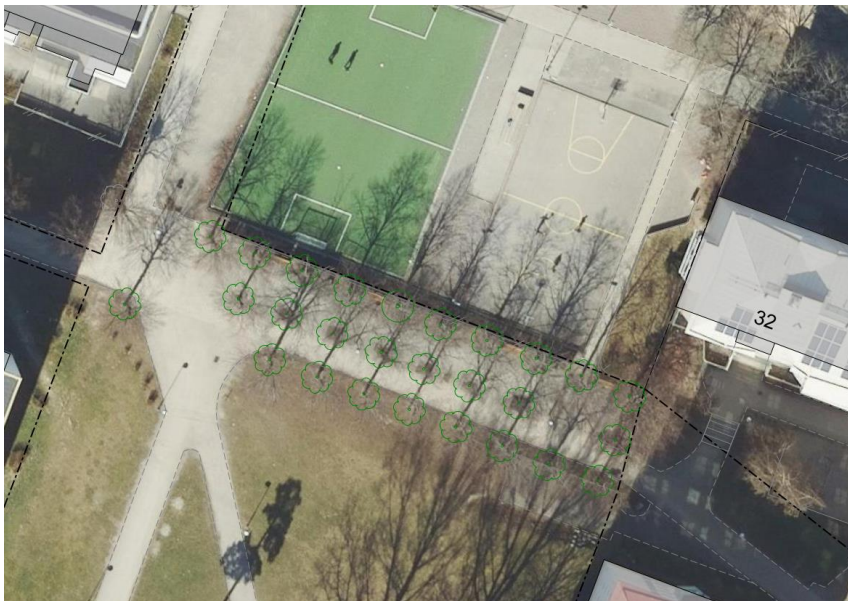
Kartbild över Askebyallén