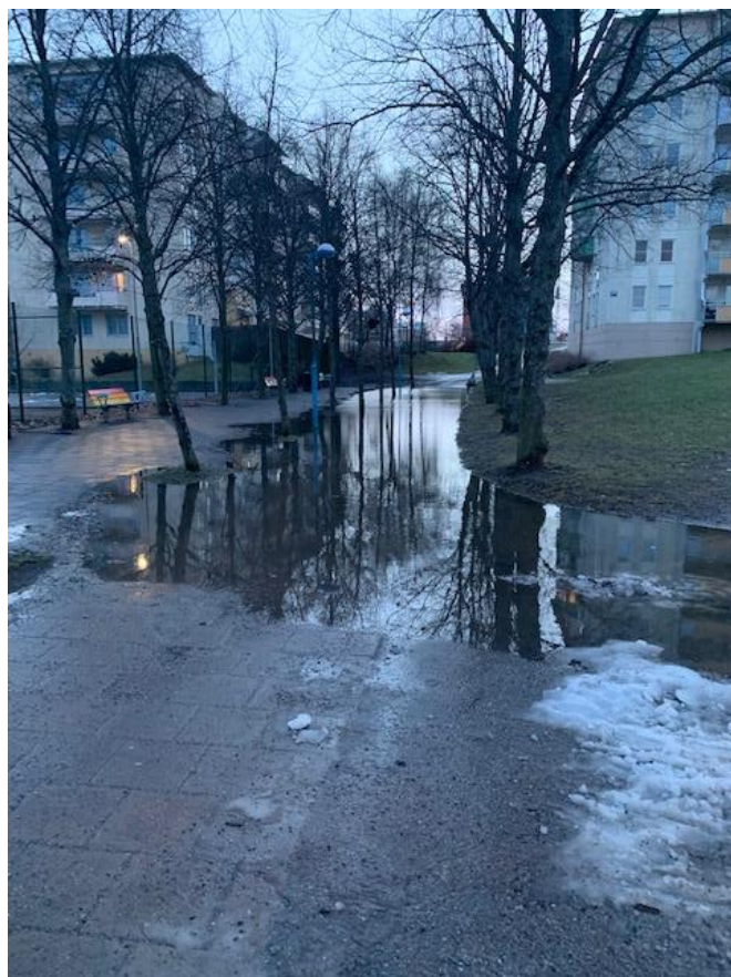
Bilder vid Askebyallén som visar översvänningsproblematiken på platsen.