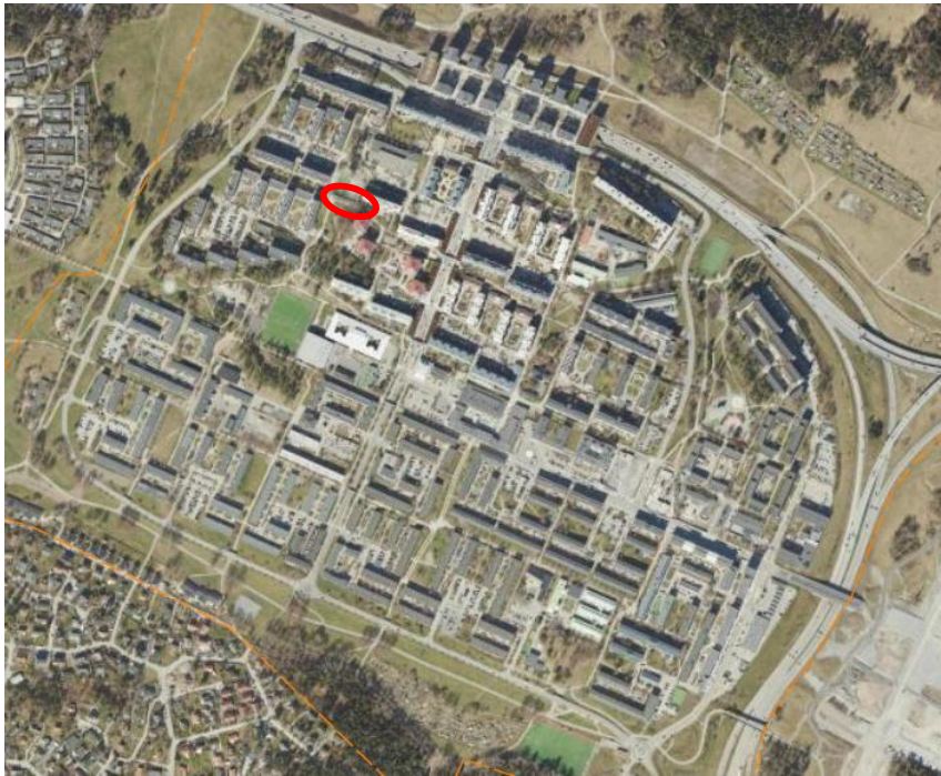
Kartbild över Rinkeby där den röda markeringen visar Askebyalléns lokalisering.