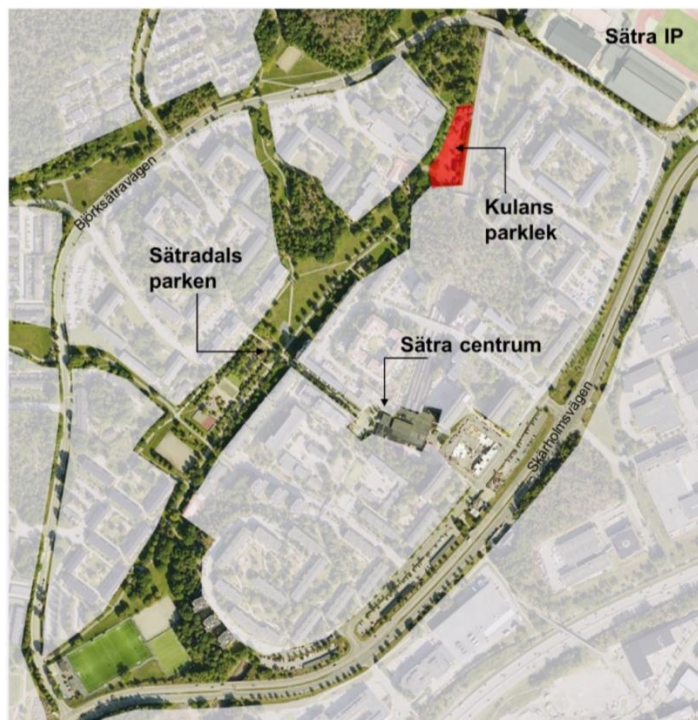
Karta 3. Kulan parklek i relation till Sättra centrum.