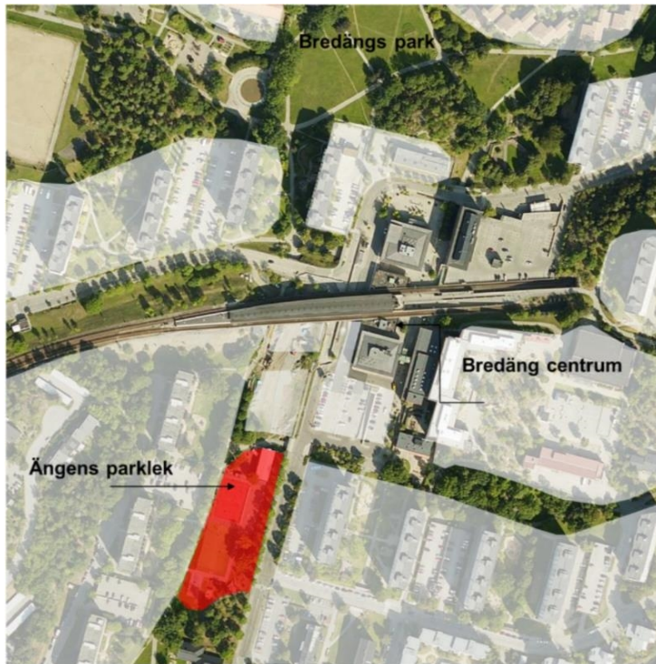
Karta 2. Ängens parklek i relation till Bredängs centrum.