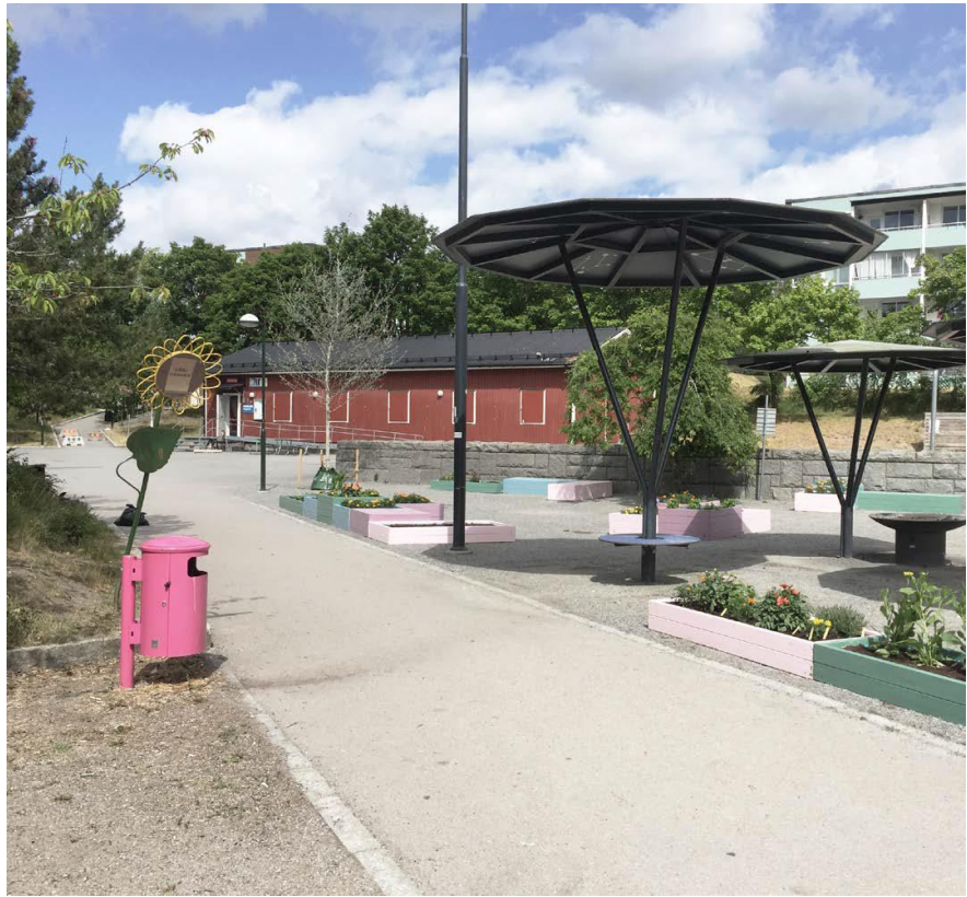
Vårgården, vy mot nordväst, sommaren 2018