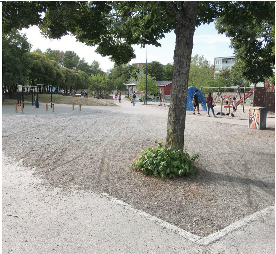
Vårgården, entrézon, sommaren 2018