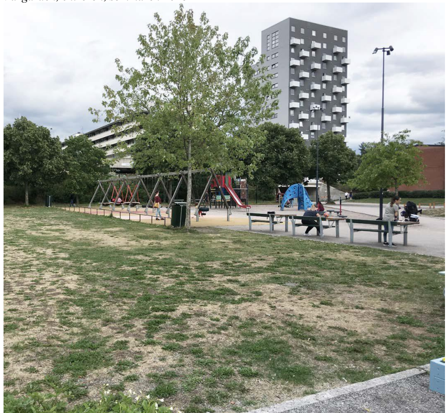
Gräsmattan och lekutrustning i bakgrunden, sommaren 2018