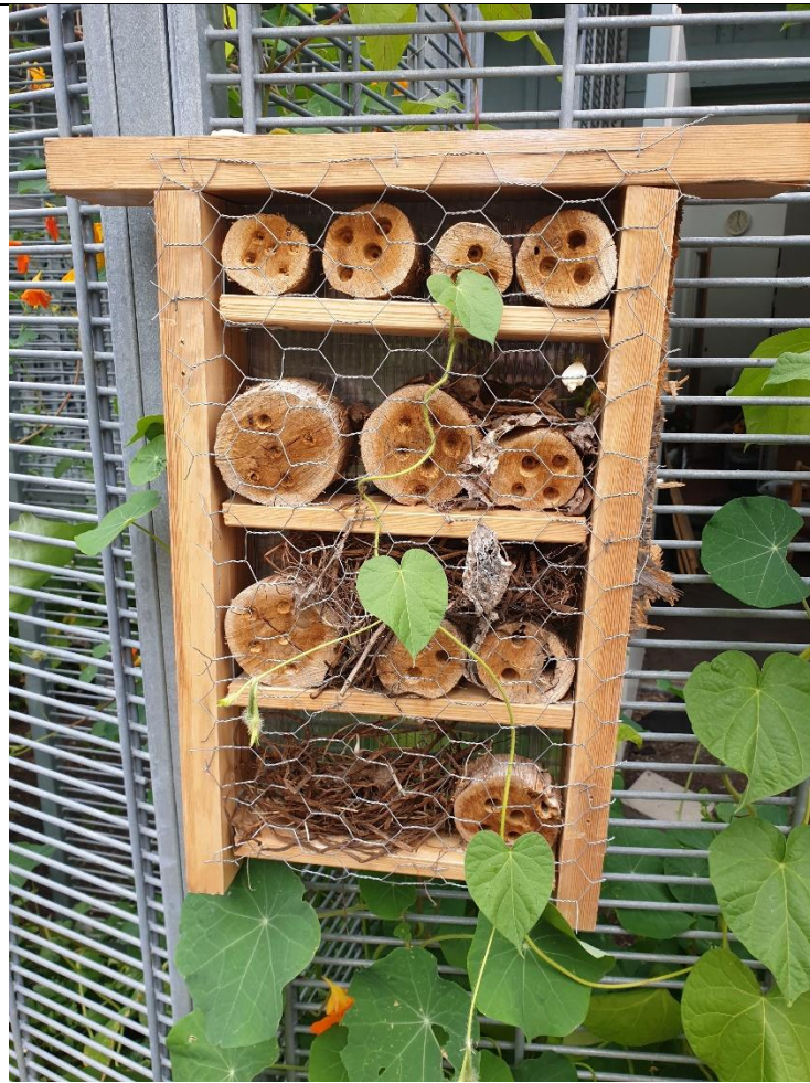
Bild 4. Stadsodling i parkleken Kulan. Insektshotell.