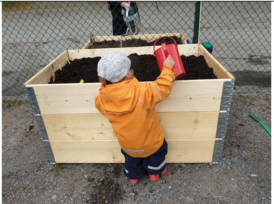
Bild 6. Stadsodling i parkleken Ängen. Sådd och bevattning.