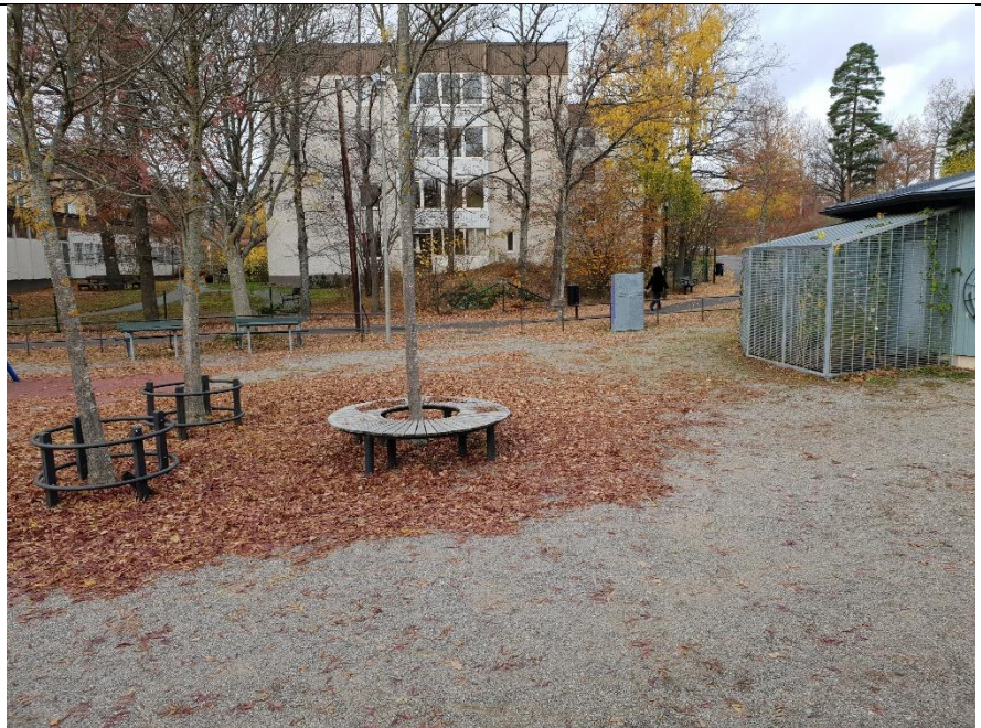
Bild 2. Parkleken Kulan. Innan påbörjad investering