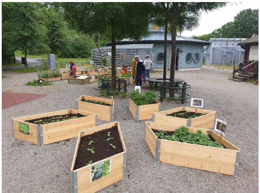
Bild 3. Stadsodling i parkleken Kulan.