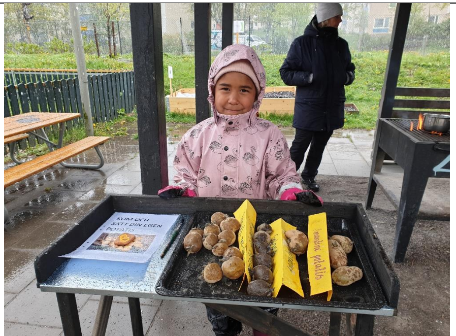
Bild 8. Stadsodling i parkleken Kulan. Potatis för sättnig.