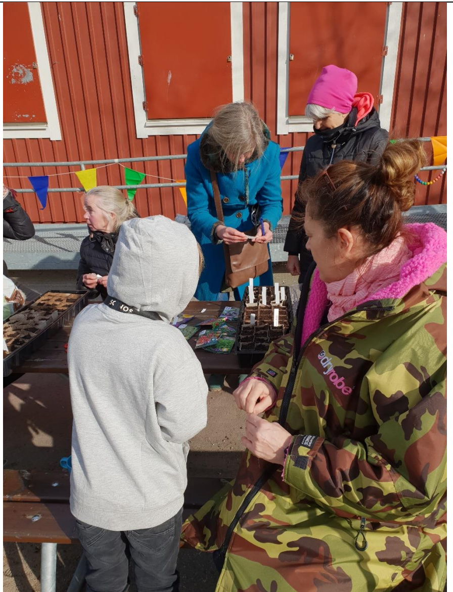
Bild 5. Stadsodling i parkleken Kulan. Sådd.