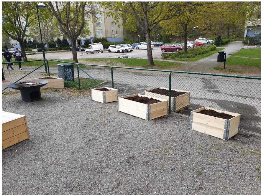
Bild 7. Stadsodling i parkleken Ängen. Anläggning av pallkragar.