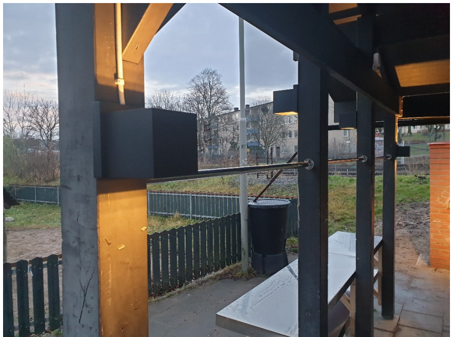
Bild 9. Belysning i utomhuskök, Kulan parklek.