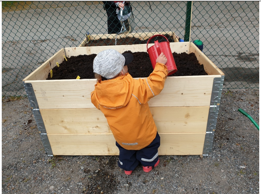
Bild 6. Stadsodling i parkleken Ängen. Sådd och bevattning.