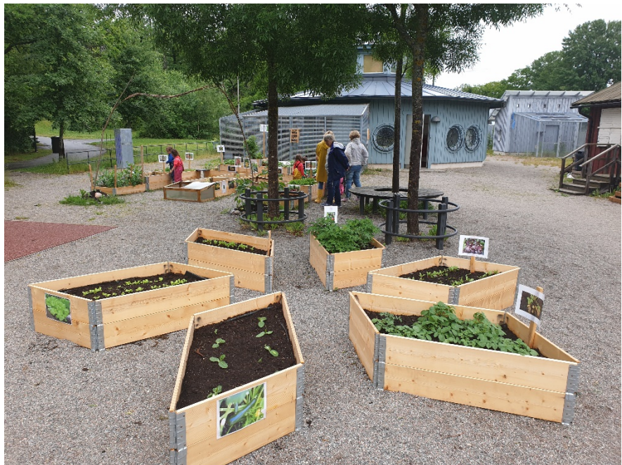
Bild 3. Stadsodling i parkleken Kulan.

Infoga bilder från plats efter trygghetsinvestering.