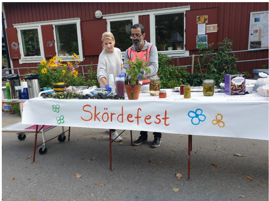
Bild 9. Skördefest.