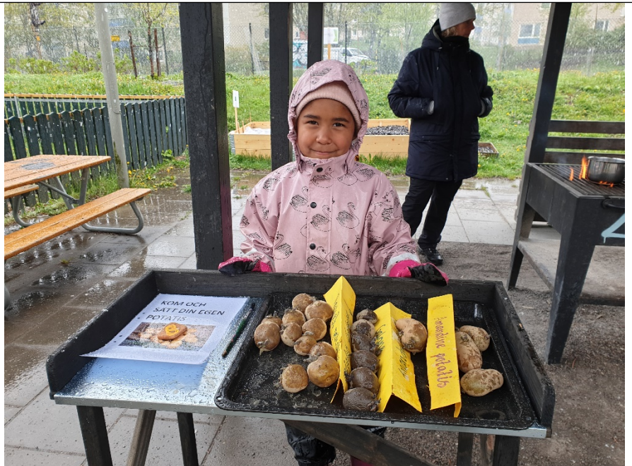
Bild 8. Stadsodling i parkleken Kulan. Potatis för sättning.