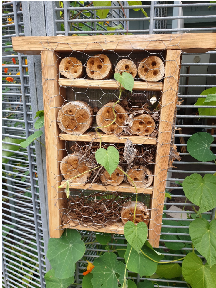
Bild 4. Stadsodling i parkleken Kulan. Insektshotell.