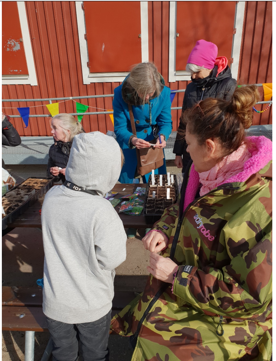
Bild 5. Stadsodling i parkleken Kulan. Sådd.