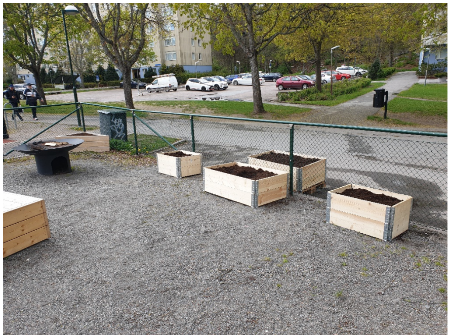
Bild 7. Stadsodling i parkleken Ängen. Anläggning av pallkragar.