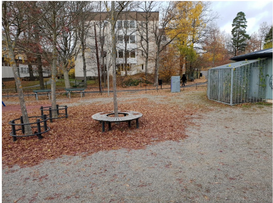
Bild 2. Parkleken Kulan. Innan påbörjad investering