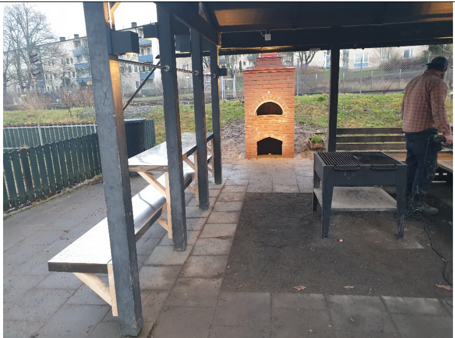
Bild 10. Utomhuskök i Kulan parklek