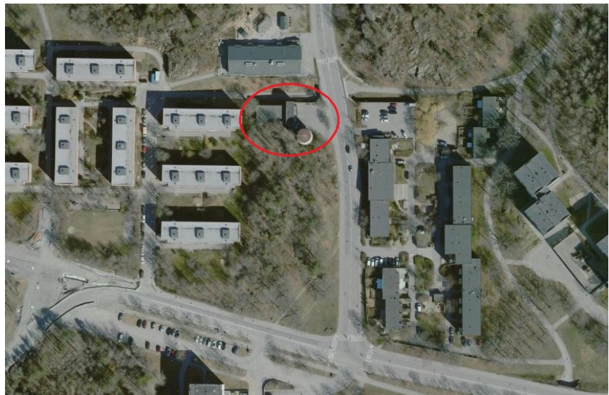
Figur 2. Ortofoto. Markeringen visar markanvisningsområdet.

Kontoret tecknar markanvisningsavtal med byggherren enligt detta utlåtande.