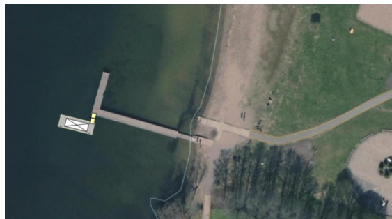
Bild 1. Skiss placering av flytbrygga med bastubyggnad vid Sättrastrandsbadet

Under 2021 har förvaltningen initierat en upphandlingsprocess, ansökt om erforderliga tillstånd samt tagit fram ett avtalsutkast för drift, underhåll och brukande av bastun med Sättraskogens bastuförening.