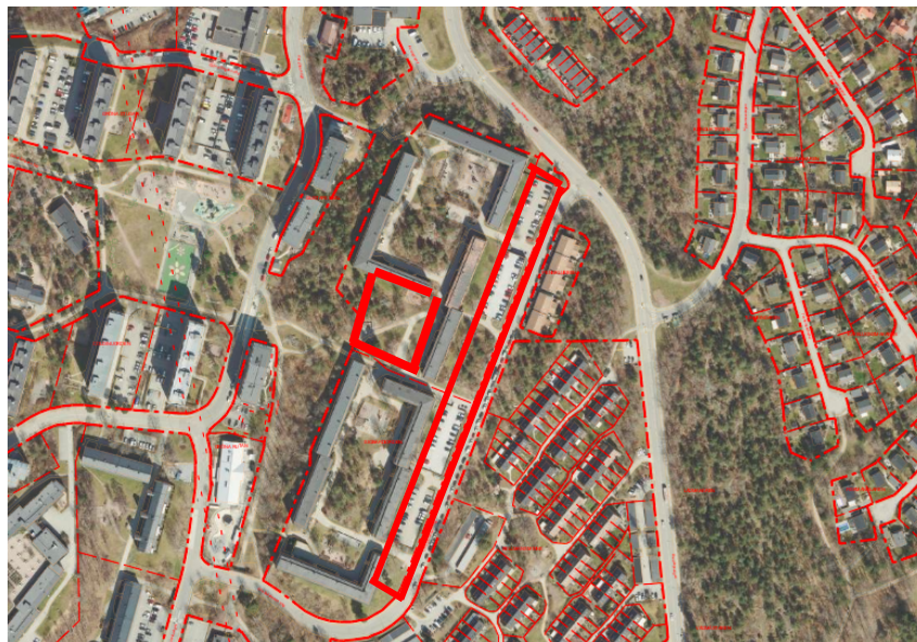
Bild 2. Aktuellt markanvisningsområdet markerat i rött.

Exploateringen innehåll och utformning kommer att prövas i planprocessen.