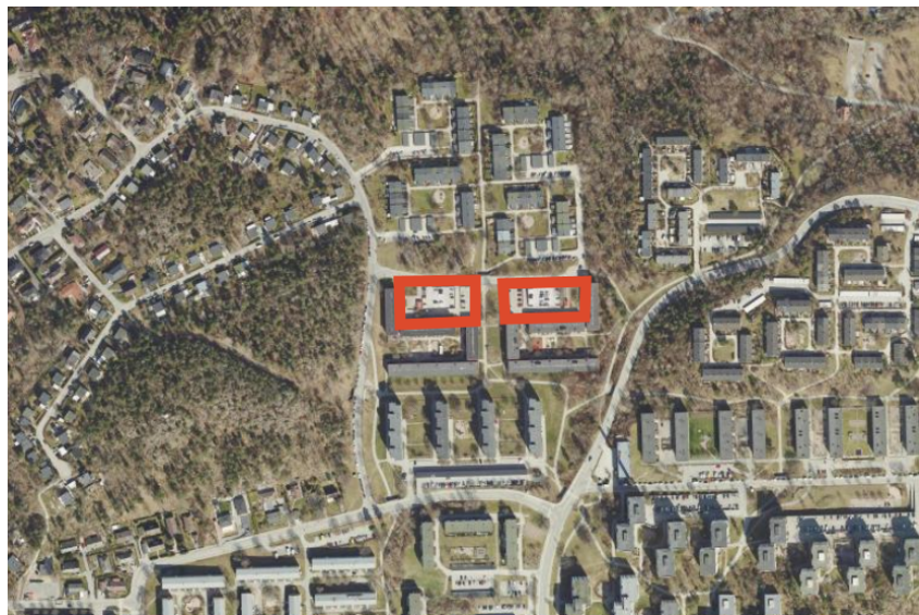
Figur 2. Ortofoto som visar förslag till markanvisning på fastigheterna Fårholmen 1 och Bredholmen 1.

Markanvisning sker enligt de principer som kommunfullmäktige beslutat om i stadens markanvisningspolicy. Markanvisningen gäller under två år från nämndens beslut. Marken kommer upplåtas med tomträtt.