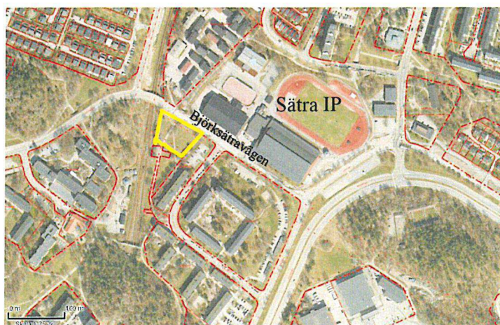
Markanvisningsområdet markerat med gult

Förslaget innehåller nybyggnation av cirka 80 lägenheter i flerbostadshus med parkering i garage. Bolaget föreslår att lägenheterna ska upplåtas med hyresrätt och marken upplåtas med tomträtt.