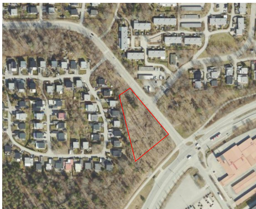
Figur 2: Markanvisningsområdet föreslås inom det rödmarkerade området på del av fastigheten Sätra 2:1.

Förslaget innehåller nybyggnation av sex lägenheter i ett friliggande LSS-boende. Bolaget föreslår att lägenheterna ska upplåtas med hyresrätt. För ett LSS-boende om 6 lägenheter beräknas det finnas ett behov för ca 6-8 anställda.