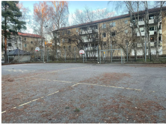
Inspirationsbilder från andra platser: