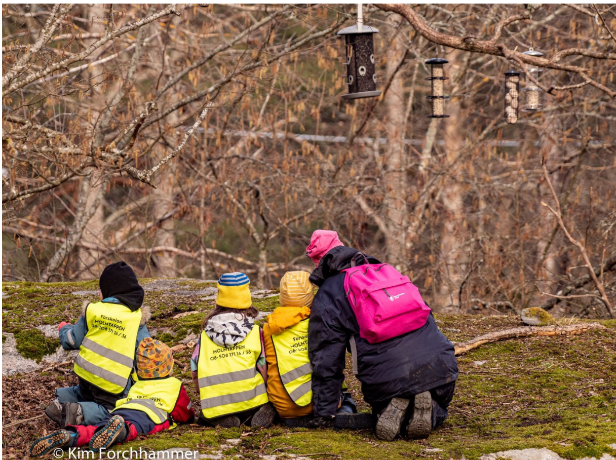
Bild: Förskolegrupp studerar fåglarna vid fågelmatningen

Under sportlovet har det också under flera år anordnats särskilda visningar med fågelguidning för intresserade, vilket också har varit mycket populärt. Visningarna har gjorts av kunniga privatpersoner i samarbete med Skogsluffarnas orienteringsklubb, som håller våffelcafé i Brotorpstugan under sportlovet samt varje helg från februari fram till påsk. Även skyltar med bilder på de fåglar man vanligtvis får se vid fågelmatningen, har satts upp (se bilaga).