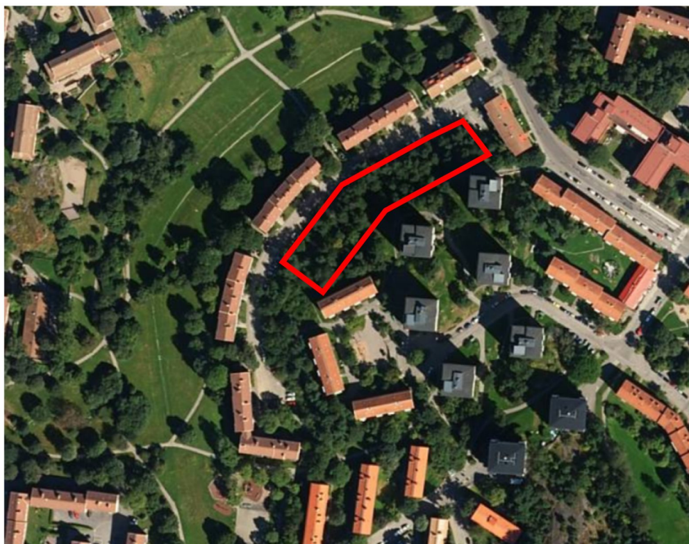
Figur 1 Aktuellt område längs Tavelsjövägen.

Aktuell fastighet är belägen utmed Tavelsjövägen längs vägens sydöstra sida, se Figur 1.