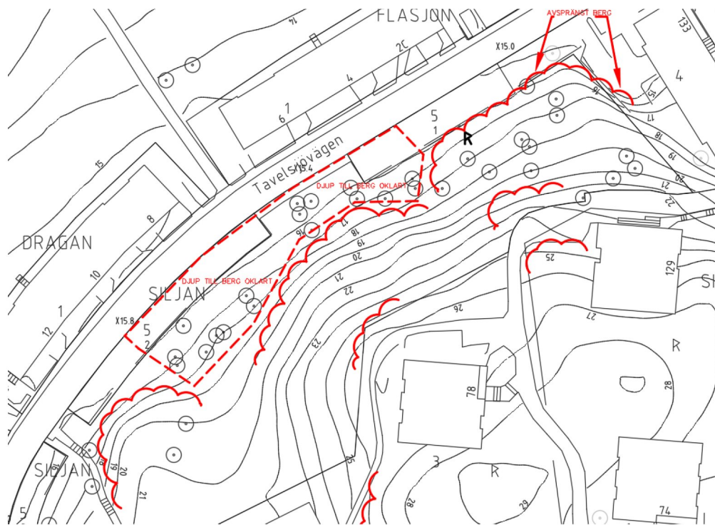
Figur 2 Berg i dagen samt ett markerat område inom vilket djup till berg är oklart.

Jordlagerföljden inom aktuellt område består i huvudsak av ett tunt lager vegetationsmaterial på ytnära berg. Berg i dagen förekommer på flertalet ställen, se Figur 2. Inom markerat område i Figur 2 antas djupet till berg öka och jordlagerföljden bedöms under ett lager vegetationsmaterial bestå av lera på friktionsjord på berg. Djup till berg är enligt intilliggande sonderingar uppemot ca 4 - 5 m, se Bilaga 1.