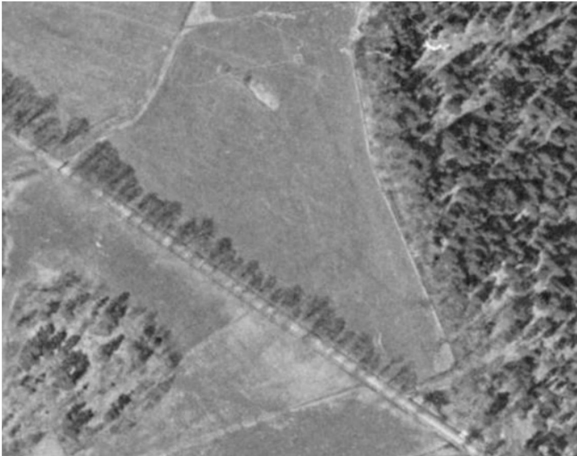
Fig 2. Flygbild över området (år 1955-1967). Enligt historiskt ortofoto utgjorde aktuellt område tidigare åkermark och grönområde.

Enligt Historiska ortofoton (1955-1967) utgjordes området tidigare av åkermark och grönområden (se fig. 2 nedan). Inom den exploaterade delen av fastigheten finns idag Memory Hotel. Memory Hotel byggdes på 1990- talet. Aktuellt undersökningsområde inom fastighet består idag av ej bebyggda markytor och utgörs i stort av samt parkerings- och körytor, samt grönområden.