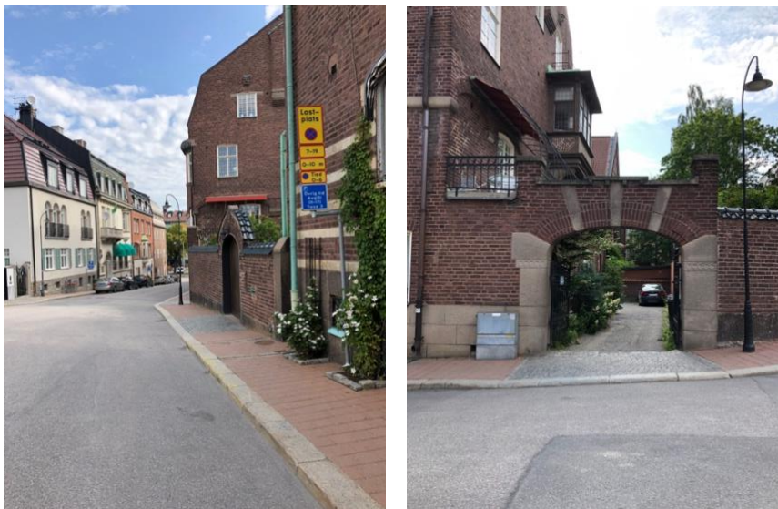
Figur 4: Lastplats på Sköldungagatan 2 t.v. och portik till parkering på Sköldungagatan 4 t.h.