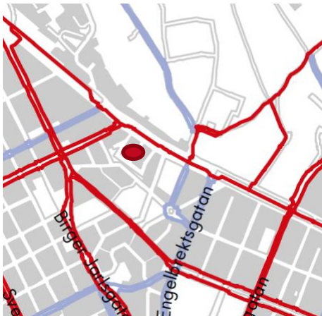
Figur 3: Pendelstråk (rött) och huvudstråk (blått) för cykel.

Cykling sker i blandtrafik på omkringliggande gator men omges av pendelstråk (rött i Figur 3) på Valhallavägen, Odengatan och Karlavägen. Utpekade huvudstråk (blått i Figur 3) löper längs Danderydsgatan/Engelbrektsgatan och Drottning Kristinas väg.