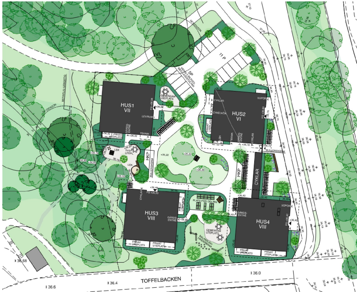
Figur 1 – Utklipp ur "Situationsplan Tåjärnet, ÅWL, 2019-01-14