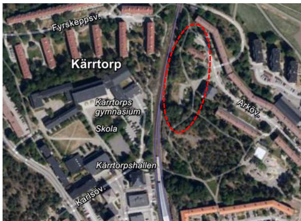
Figur 1. Lokalisering av aktuellt planområde (inringat) inklusive den närmaste omgivningen.

Vid Arkövägen i stadsdelen Kärrtorp i Stockholms stad har ett planarbete påbörjats som syftar till att möjliggöra uppförande av ny bostadsbebyggelse i närheten av Kärrtorps centrum. Det aktuella området ligger i anslutning till tunnelbanans gröna linje (se figur 1).