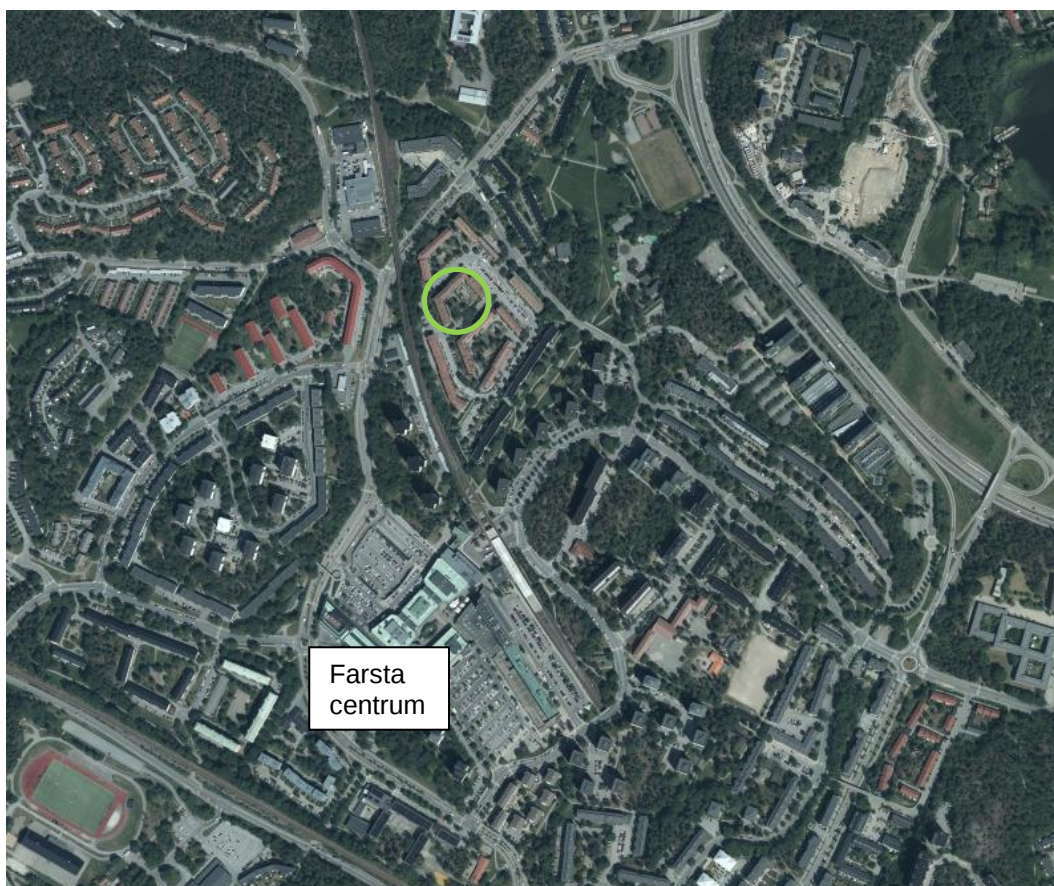
Figur 1. Lokalisering av den undersökta fastigheten ses markerad med en grön cirkel (VISS, 2021).

Ledarö 3 är belägen cirka 400 meter norr om Farsta centrum och ligger inom ett bostadsområde med tillhörande parkeringsplatser och bilvägar runt om. Cirka 50 meter väster om fastigheten återfinns spår för Stockholms tunnelbana spår, se Figur 1 .