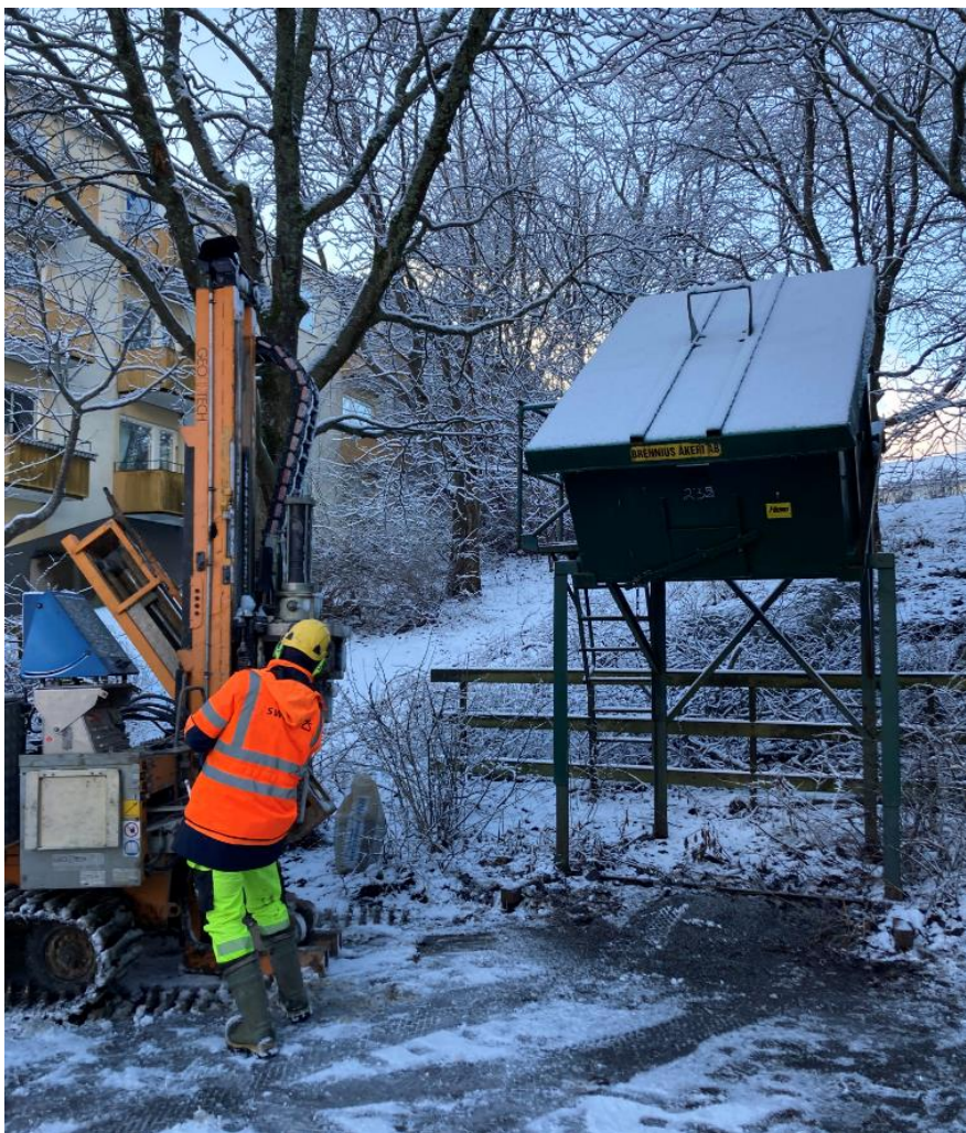
Figur 3. Foto från undersökningen där den punkten BH3 borrades.

av bly överskrider Naturvårdsverkets generella riktvärde för MKM med mer än 42 gånger i den övre halvmeteren och nästan 2 gånger i halvmeteren under. Halterna av PCB överskrider riktvärdet för MKM med 7 gånger. Förutom att punkten var intill ett grusintag gjordes inga fältobservationer som skulle kunna tyda på dessa höga bly-, koppar- eller PCB-halter, se Figur 3 . Halterna överskrider det rekommenderade åtgärds målet för fastigheten och bör saneras bort.